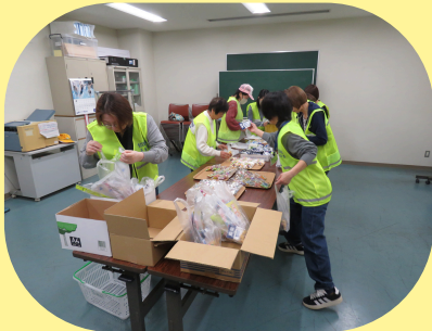
配布物の袋詰め作業中