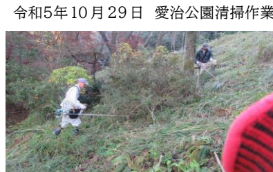
令和5年10月29日 愛治公園清掃作業