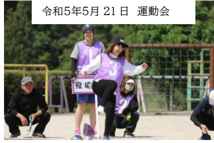
令和5年5月21日 運動会