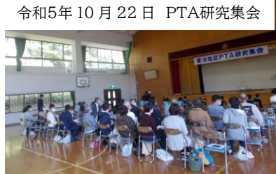
令和5年10月22日 PTA研究集会