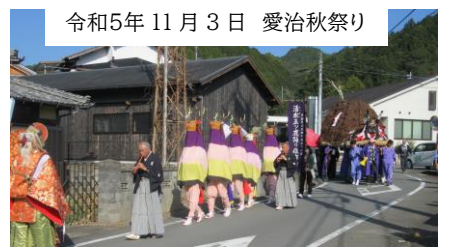
令和5年11月3日 愛治秋祭り