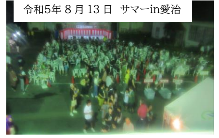
令和5年8月13日 サマーin愛治