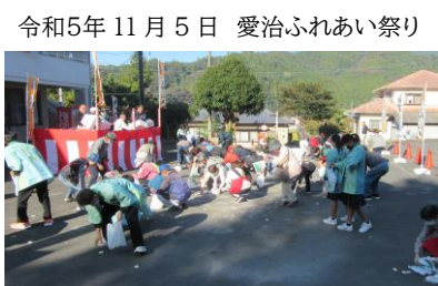
令和5年11月5日 愛治ふれあい祭り