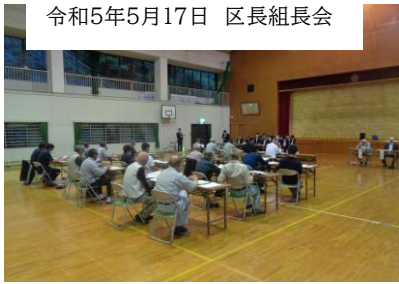
令和5年5月17日 区長組長会