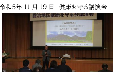
令和5年11月19日 健康を守る講演会