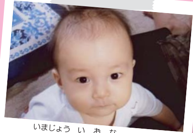
いまじょう いおな

歩くん保育所たのしいね。もりもり 食べて元気に遊ぼう！でもいたず らはほどほどに。