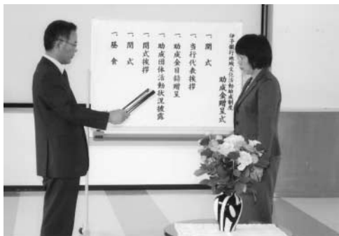
▼贈呈式（上）と武左衛門太鼓クラブ（下）

この制度は、伊予銀行が平成4年から実施しているもので、地域の伝統的な文化活動に対して資金面で支援をし、地域独自の文化の継承や地域生活文化の水準向上に寄与することを目的としています。これまで744団体が助成を受けており、今回は武左衛門太鼓クラブなど19団体に総額390万円の助成金が贈られました。