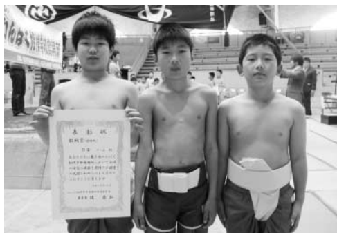
▶敢闘賞の日吉小学校チーム

大会には、宇和島市、愛南町などから小学生65人が参加。個人戦と団体戦で争われ、一気の押し出しや逆