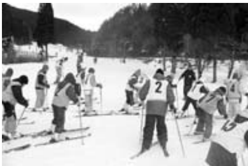
▶スキー教室参加者

り方を児童に説明。低学年の児童は、細かい作業に悪戦苦闘しながらも、老人クラブの会員や上級生に教えてもらいながらしめ縄を作っていました。また、全員のしめ縄ができた後、児童から老人クラブの皆さんに感謝の気持ちを込めた手作りのプレゼントが贈られました。