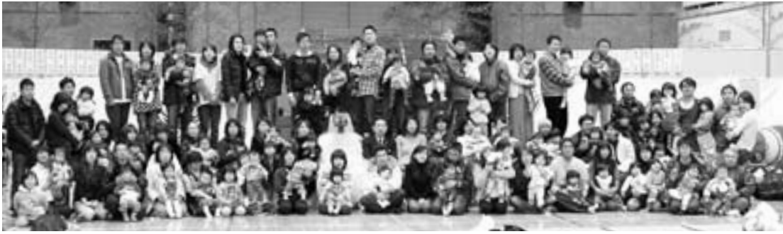
▶天狗を囲んで記念撮影

「鬼ヶ城山に住む天狗は、太鼓の音につられて山里に下り、一人の子どもと出会う。しかし、子どもは天狗の恐ろしい顔に驚き、泣いてしまう。子どもが大好きな天狗は困り果て、驚かせてしまったお詫びに、神通力で子どもに健やかな成長と幸せをもたらす―」