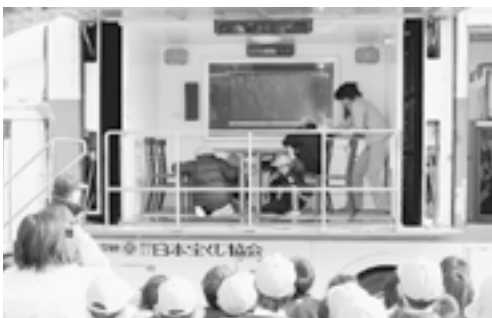
▶地震車で震度6強を体験する児童

当日は雪が舞う厳しい寒さの中での実施となりましたが、参加者は、振舞われたぜんざいを食べながら、天高く舞い上がる炎を眺め、家内安全と無病息災を祈願しました。