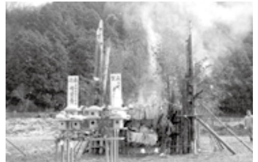
▶どんど焼きの様子