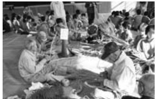
▶しめ縄づくりの様子

幻想的な会場に太鼓の音が響く中、2人の天狗が登場。泣き叫ぶ子どもを天狗が一人ひとり抱き抱え、「元気に育て」「かわいく育て」「大きく育て」と叫ぶと同時に、保護者が力強く太鼓を打ち鳴らし、天狗と共に子どもの健やかな成長を祈願しました。