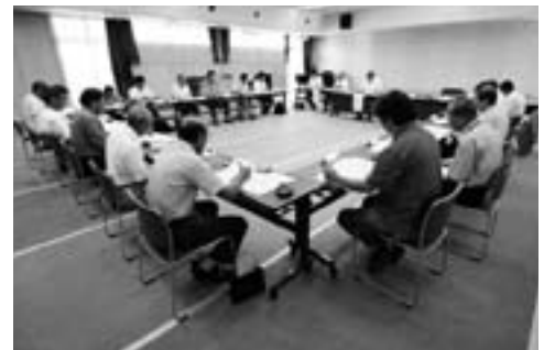
▲町営バス愛治線、屋敷線について協議する会員