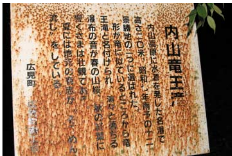
写真右／高さ20mを誇る竜王滝。 写真上／苔に覆われた深緑の岩とその合間を流れる透明度の高い水。 写真下／竜王滝手前の案内板。この看板から約30m進むと竜王滝に到着。