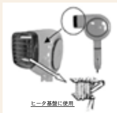
ヒータ基盤に使用