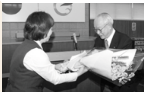
2月10日に行われた退任式

登庁後、臨時職員会が役場3階議場において開催され、職員約90人を前に「厳しい財政状況の中、新しくできた町の町長として、責任の重大さを痛感している。13年前の初心に返り、夢をもって任にあたりたい。職員には夢を実現する情熱と努力を求めたい。」と訓示しました。