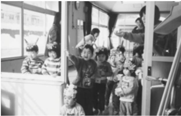
鬼はそとー！福はうちー！

2月3日、みどり保育所で、園児たち全員による「節分」の豆まきが行われました。園児たちは、お互いが鬼に扮して、「鬼はそと、福はうち！」と、元気よく豆まきを行いました。みんな自分の中にいる悪い鬼を追い払えたかな？