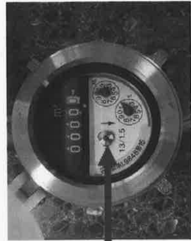
パイロットマーク

なお、漏水による使用水量の増加分にも水道料金がかかりますのでご注意ください。(不可抗力による地下漏水等の場合に限る、水道料金の減免が受けられる場合がありますので水道課までご連絡ください。)