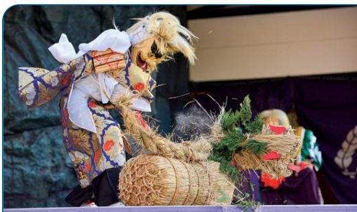
国指定重要無形民俗文化財の御嶽神楽。 力強く華麗で勇壮な舞が特徴。

鋭く尖った稜線や岩壁など荒々しい姿を持つ祖母山は、地域の人々の畏敬の念を集めてきました。