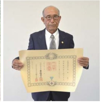
▲受章を喜ぶ高田さん