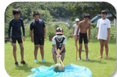
もうちょい右！そのまま叩け～