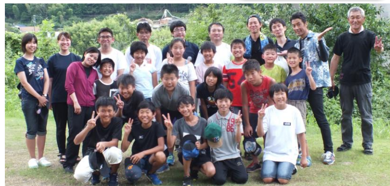
ご協力いただいた皆さん、本当にありがとうございました！