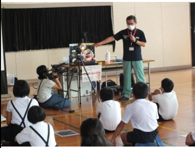
地球温暖化の仕組みやどうすれば防げるのか学びました。

8月20日（木）夏休み期間中の全校登校日、ふれあい体験学級科学実験教室を開催しました。