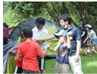
上手く建てれたよ ♪

まず荷物置き場と着替え用のテントを設営。そして待ちに待ってた遊泳。流れが速く危険な場所や足が届かない深い場所を確認し合いながら、みんな四万十川を満喫していました。昼食は飯盒炊飯とバーベキュー。4班に分かれて火を起こすところから自分たちで準備。美味しくご飯も炊けていました。最後はスイカ割り。割ったスイカはみんなで美味しくいただきました！