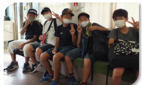
キャンプ場から歩いて江川崎駅へ。予土線で出目駅まで帰ってきました。