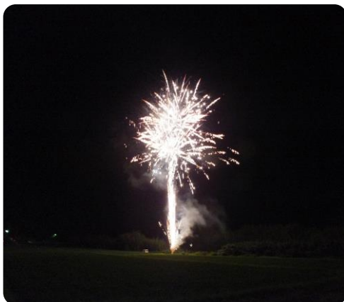
短い時間でしたが綺麗な花火が打上げられました。

当日ご協力いただいた、消防団第5分団、交通安全協会泉支部、交通安全指導員の皆さん、ありがとうございました。