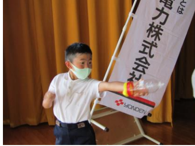
ペットボトル工作では低学年が空気砲、高学年が糸巻き戦車を作り、動力実験を行いました。