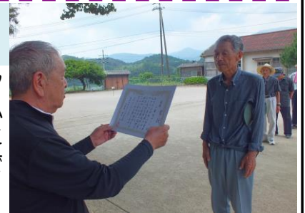
小倉Bチーム優勝おめでとうございます