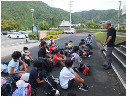
泉公民館前での開講式。この後、町マイクロバスでキャンプ場へ出発！