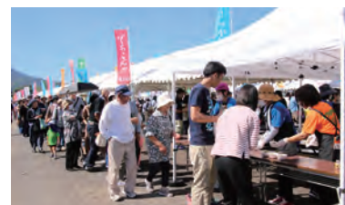
▲ジャンボきじ鍋に並ぶ長蛇の列