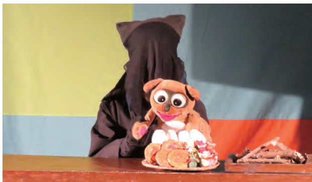
▲人形劇「このつぎなあに」の一場面

今年は、「このつぎなあに」の人形劇を披露。子どものみならず大人もその物語の世界観に引き込まれていました。