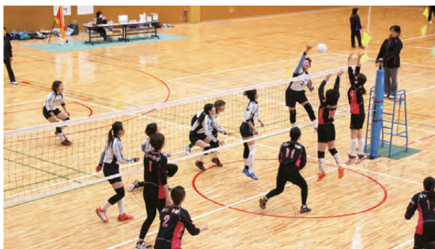
▲仲間の思いを込めて力強いアタック