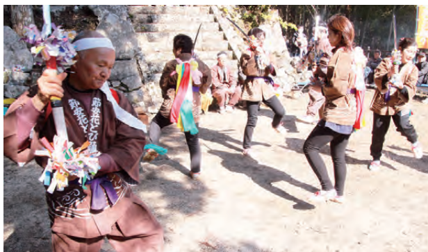
▲それぞれの願いを込め、勇壮な舞いを披露

これは、安産、家内安全や地区の安泰を祈願して奉納されるもの。今年は7人の安産祈願と授かり祈願が行われ、会員らによる力強い舞いが披露されました。