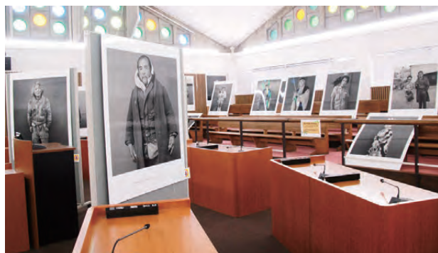
▲スタンドグラスと相まって幻想的な雰囲気に

会場には大きさ1200×1000の迫力ある個性豊かな写真が多数展示され、その独特な世界観で訪れた人を魅了していました。