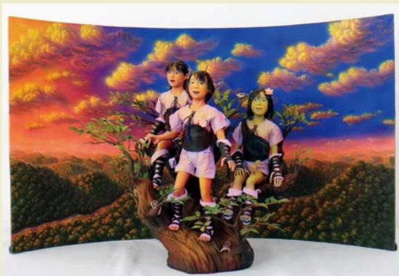
みま森 杉山 幸則さん(千葉県)