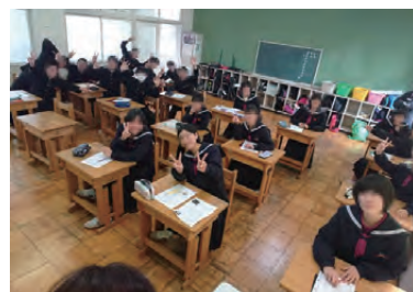
▲広見中学校の生徒たちとともに