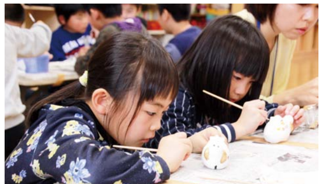
▲先生に教わりながら細かい作業に挑む子どもたち

わかば作業所の職員を講師に迎え、平成31年の干支である亥をかたどった白い土鈴を絵の具で思い思いに彩る子どもたち。真剣な様子で丁寧かつ大胆に絵付けを行い、個性豊かな土鈴を完成させていました。