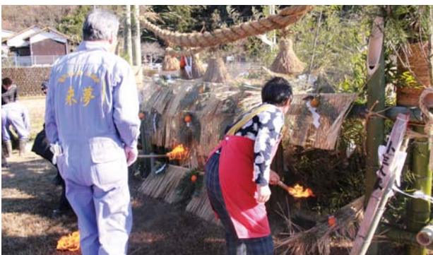
▲やぐらに火入れを行う代表者たち

愛治地区では1月13日に開催。愛治活性化集団「来夢」が用意した高さ約5メートルものやぐらに多くのしめ飾り等が投げ込まれ、参加した人たちは今年1年の無病息災を祈願していました。