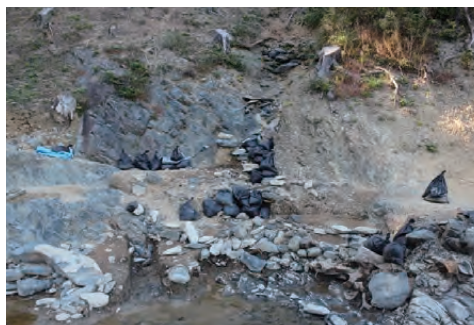
発掘調査の進む庭園の滝・池の様子

いくと、滝の正面には新・旧2時期の石積みとそれらに対応する2時期の平坦面が検出され、少なくとも2回の改修を経ていることが判明しました。また、護岸に縁石をめぐらせた池も新たに見つかり、水は滝や湧水、石組み取水路から引き入れていることも分かっています。調査途中ではありますが、庭園の専門家からは「鑑賞用というよりは、水処理という機能に主眼が置かれた庭園」という評価がなされています。一方、周囲には観音堂跡や推定弁財社、小祠などの建物跡がみられ、祈りの空間を作り出していたようです。