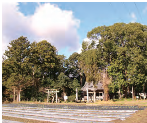
▲深く生い茂った高鴨神社の社叢(神社の森)