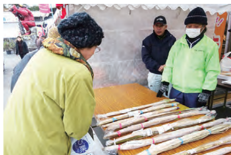
▲山芋を買い求める来場者

また、毎年大好評のすりおろした山芋をかけた「とろろご飯」の販売には、販売開始直後からあっという間に大行列。購入した人たちは、炊き立てのご飯と一緒に美味しそうに頬張っていました。