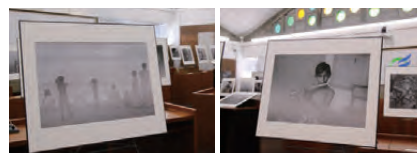
◀昨年度の展示の様子