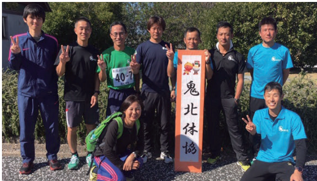
きほくたいぎょうりくじょうぶ 鬼北体協陸上部