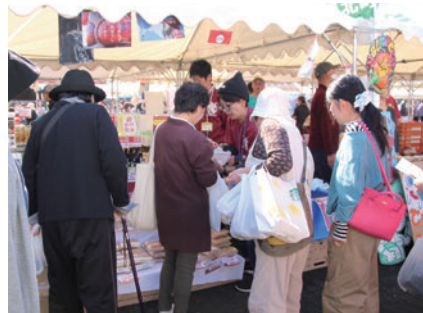
▲森の三角ぼうしのブースの様子

私は森の三角ぼうしのブースにて、たくさんのお客さんとの出会いがありました。お話しさせていただくことで、今後の商品開発に活かせるので、これからも出会いの場を広げていきたいです。