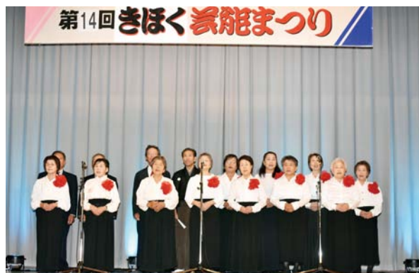
◀ 清吟堂吟友会の皆さん

舞踊、社交ダンスや詩吟など、町内の芸能団体10団体がさまざまな演目を披露し、その勇姿に観客からは盛大な拍手が送られていました。