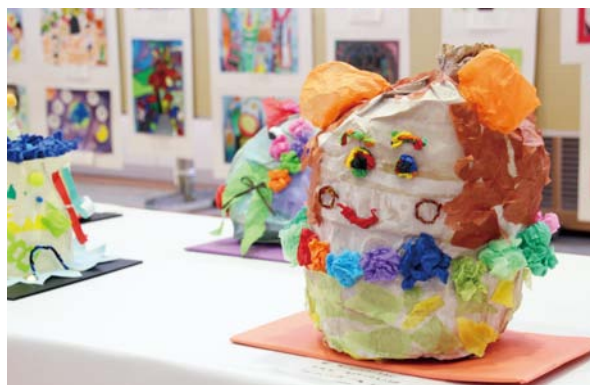
◀ 思わず目を細める可愛らしい作品

会場には、町内各保育所、小中学校や各種文化団体等による渾身の作品が多数展示され、訪れた人を魅了していました。