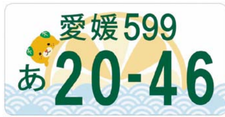
みきゃんナンバー

各地域の特色を自動車に施す、地方版図柄入りナンバープレートの交付を10月1日(月)から開始します。愛媛県の図柄は「みきゃん」がモチーフです。取得方法等、詳しくは県ホームページで「みきゃんナンバー」を検索してください。