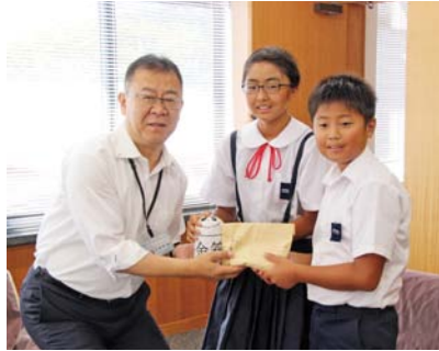
▲泉小学校から心温かな支援

この支援金は、自らが被災者でありながら、極めて厳しい状況の中、長期間にわたり住民の皆さんの安全確保のため、避難誘導や救出、復旧等に懸命な活動を続けてこられた消防団員に対する感謝の気持ちを込めて、贈られたものです。