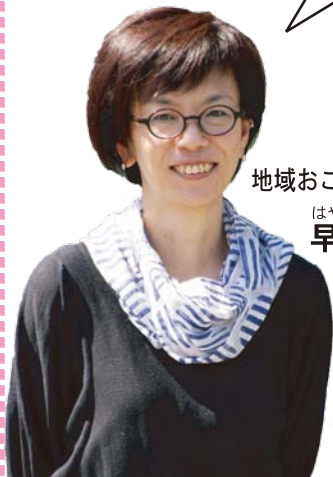
地域おこし協力隊1年目

皆さん、こんにちは！ まだまだ暑い日が続く、涼しくはありませんが、少しずつ秋の気配を感じてきましたね。 これから紅葉など、秋の景色が楽しみです！