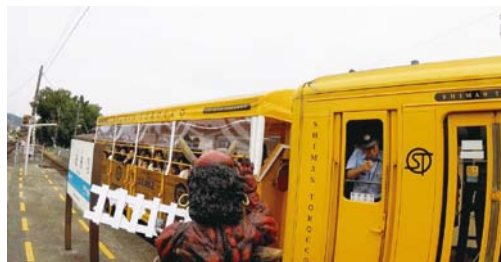
▲予土線再開イベントの様子

8月26日(日)は道の駅森の三角ぼうしで「新米まつり」がありました。鬼米が売りに売れて、鬼ぎりバイキングや鬼米試食は大盛況でした！鬼米はとても美味しかったです。ぜひ、食べてみてください！