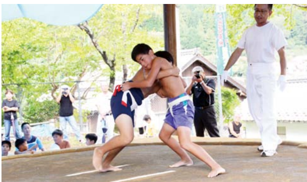
▲体と体をぶつけ合い、白熱した取り組みを見せる

日吉地区を災いから守るとされている六地藏に対する感謝と供養を示すと言われている本大会。会場では、保育園児による可愛らしい取り組みや、小学生による力強い取り組みなど、多彩な相撲が行われ、会場には観客の声援が響き渡っていました。