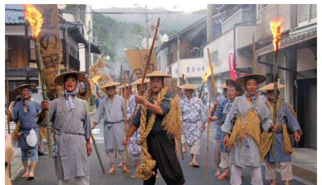
▲気合十分の掛け声とともに練り歩く武左衛門一揆行列

武左衛門一揆行列で幕を切った本イベント。会場では、日吉小学校児童たちによる武左衛門太鼓の演奏や保育園児によるダンスなど、さまざまなパフォーマンスを披露。また、毎年恒例の盆踊りでは、地元の人たちが優雅に、ときに軽快な踊りで、会場を大いに盛り上げていました。