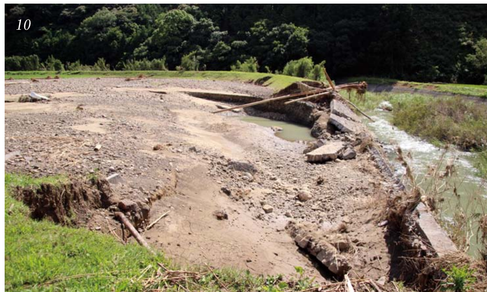
1_今にも氾濫しそうな広見川 2_濁流に流される軽トラック=大宿= 3_家屋にまで押し寄せる土石流=大宿= 4_水の勢いにより削られた道=上鍵山= 5_被害の凄まじさを物語る漂流物 6_土石流により通行不能=小松= 7_えぐられた道=国遠= 8_延々と流れ出る山水=生田= 9_氾濫する川=下大野= 10_川の氾濫により決壊した様子=西野々=