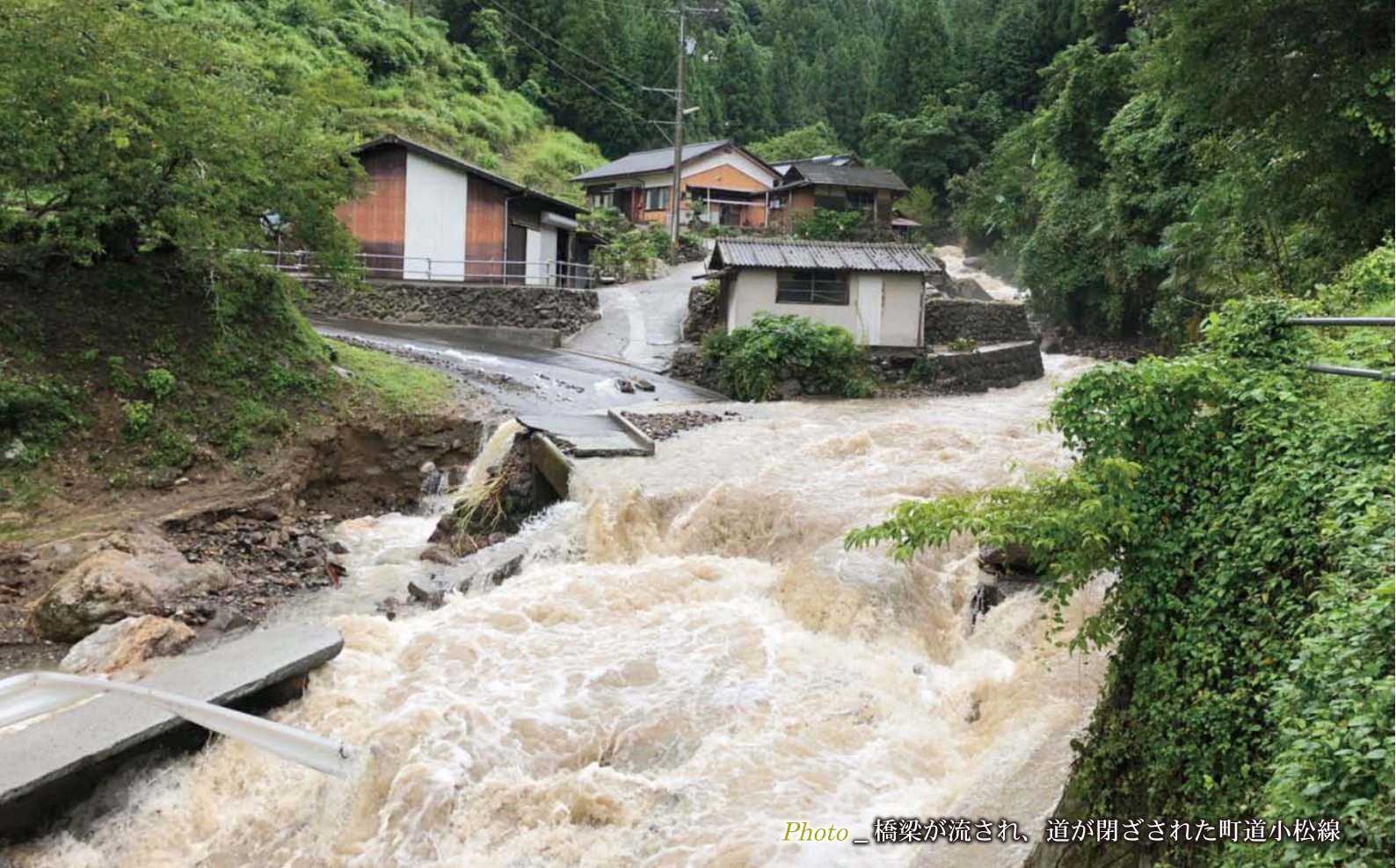
Photo_ 橋梁が流され、道が閉ざされた町道小松線