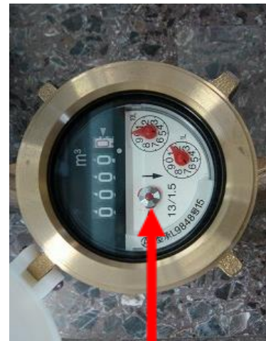
パイロットマーク

なお、漏水による使用水量の増加分にも水道料金がかかりますのでご注意ください。(やむを得ない地下漏水の場合に限り、水道料金の減免が受けられる場合がありますので水道課までご連絡ください。)