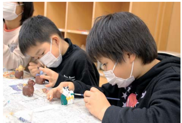
▲慎重に土鈴に色を塗る子どもたち

完成した個性溢れる土鈴を手にも、児童たちは満足そうな表情を浮かべ、先生や友人らに自慢げに披露していました。