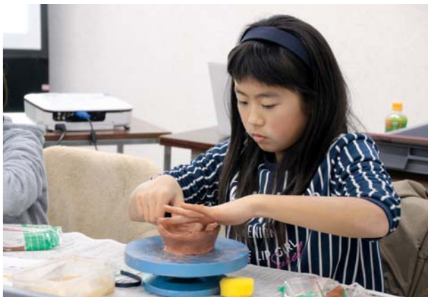
▲丁寧に粘土をつなぎ合わせ、土器を作る参加者

ほとんどの児童にとって、初体験となる土器作り。この日は、国史跡等妙寺旧境内でも発掘されている、「土師質(はじしつ)土器」と呼ばれる素焼きのお皿作りに挑戦しました。ひものように引き伸ばした粘土を積み重ね、さまざまな道具を使いながら、お皿の形へと近づけていく子どもたちの表情は、真剣そのもの。児童たちは、納得のいく形になるまで、黙々と作業を行っていました。