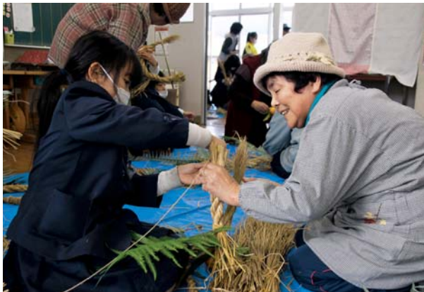
▲老人クラブの方に優しく手伝ってもらった児童

12月25日、日吉小学校で、日吉老人クラブの皆さんとともに、しめ縄作りが行われました。