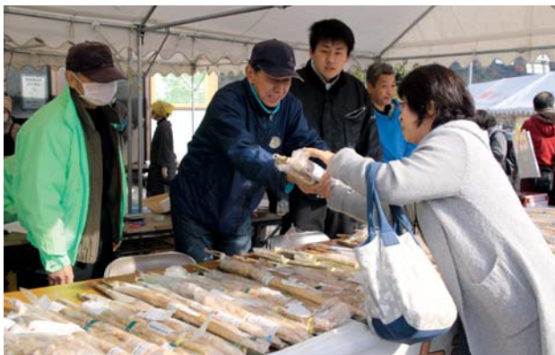
▲ずらりと並んだ自然薯を買い求める来場者

また、毎年恒例のとろろご飯の販売では、販売開始前から長蛇の列ができるほどの人気ぶり。来場者たちは、すりたてのとろろと、ほかほかの白米が織りなす美味しさに、思わず笑みをこぼしていました。