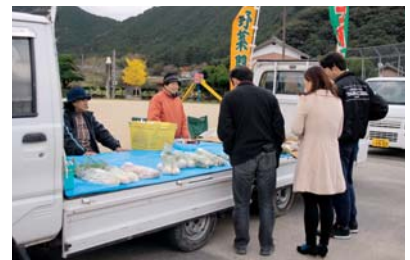
▲軽トラの荷台に並んだ野菜

また、午後から、三島小学校体育館のステージ上で、地域の人たちによる芸能発表が行われ、会場を盛り上げていました。