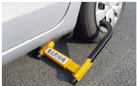
滞納⇒差押(自動車、バイク等のタイヤロック)⇒公売