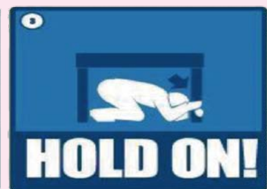
【揺れが収まるまでじっとして!】