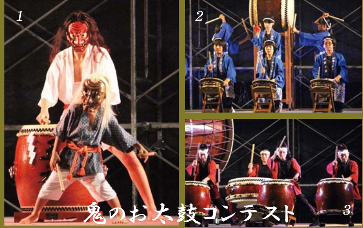
1 鬼のお太鼓コンテスト 3