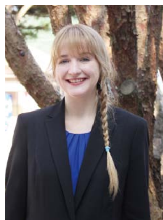
鬼北町外国語指導助手 通称：グレース アメリカ合衆国ノースカロライナ州出身 ※毎週木曜日、英会話教室を開講しています。