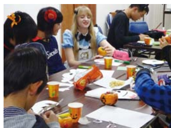
◀「柿」を使ってみんなでジャックランタン作り

について学んだり、ゲームをしたりして過ごしました。本当は、大きなオレンジのパンプキンでジャックランタンを作りたかったのですが、日本で手に入れるのが難しかったので、断念しました。しかし、その代わりに、柿を使ってジャックランタンを作りました。みんなとても上手で、とてもかわいく出来上がり、良い思い出になりました。