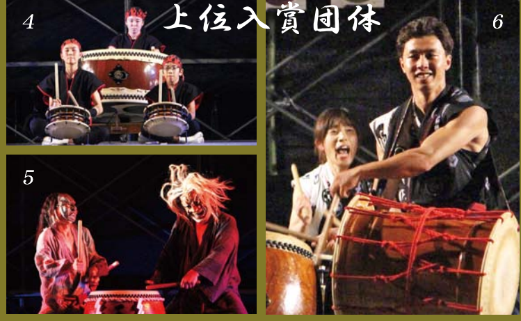
4 上位入賞団体 6