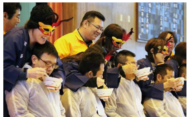
▲昨年行われたコンテストの様子