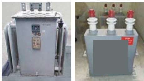
高圧トランスの例

なお、使用中の電気設備については、接触等により感電の恐れがあり非常に危険ですので、調査にあたっては、必ず電気設備を管理している電気主任技術者にご相談してください。