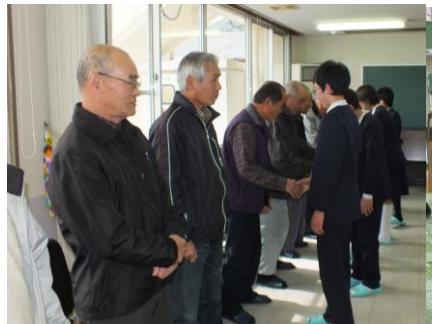
2/26 閉講式 式終了後、一年間お世話になった老人クラブの方たちと握手をしてお別れをしました。