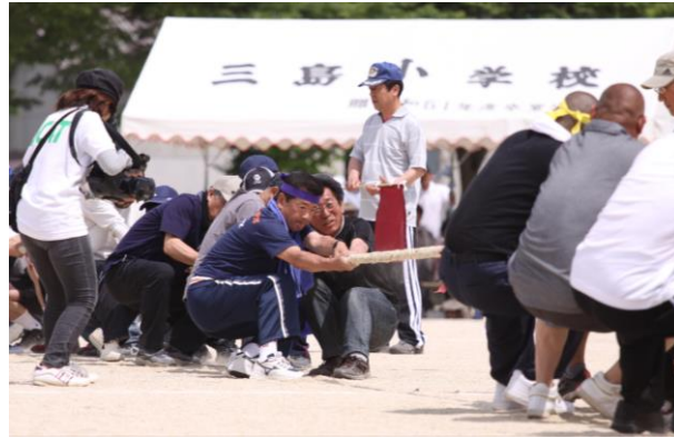
部落の威信をかけての力比べ、さすがに四試合はきつい…試合後は腕がパンパンです。

町補助金 127,000 円 自治会一般会計 55,223 円 諸収入 2 円 で運営いたしました。