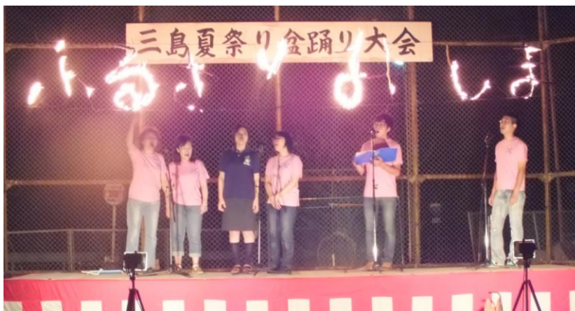
今年もコールナチュレルの皆さんと来場者の「ふるさと」の合唱で、会場が一体となりました。