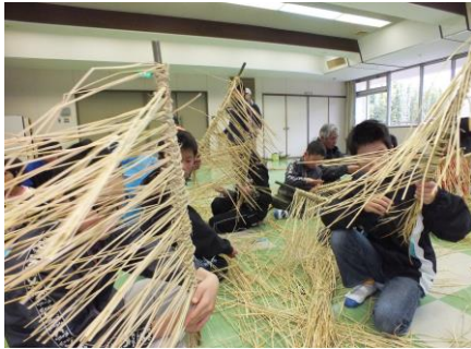
12/26 しめ飾りづくり教室 個性的なものもありましたが、みんな上手に出来上がりました。