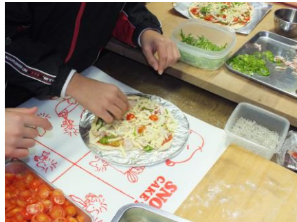
12/20 ピザ作り&陶芸体験教室 初めてのロクロ体験に悪戦苦闘かと思いきや、上手に器等を作っていました。また、ピザ作りも楽しく、焼き上がりをおいしくいただきました。