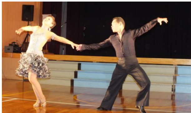
鬼北スポーツダンスサークルのお二人により1部ではサンバルンバ、2部では衣装を着替えてタンゴ・ワルツを披露して頂き、真近で見るダンスの迫力に圧倒されそうでした。

自治会一般会計 90,580 円 JA 助成金 100,000 円 南予森林組合 15,000 円 諸収入 16,801 円 で運営いたしました。