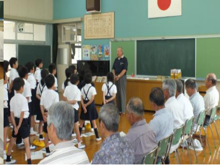
6/6 戸祇の子学級開講式 今年も戸祇の子学級の開講です。一年間お世話になる老人クラブ役員さんも出席していただきました。