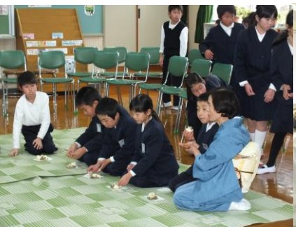
2/4 饅頭作り・お茶作法教室 おいしく出来上がったまんじゅうを茶菓子に、お茶をたしなみました。お作法も教えていただき少しお茶の心に触れることが出来たようです。