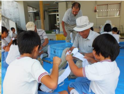
9/13 水鉄砲作り(1・2年生) 難しいところは、老人会の方に手伝ってもらい水鉄砲の完成です。