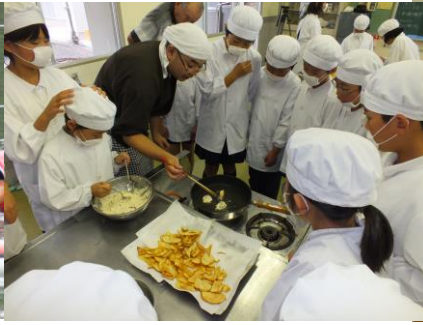
6/28 精進料理教室 今回はジャガイモの素揚げと豆腐ドーナツに挑戦しました。