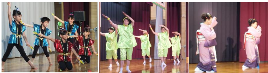
演芸の部では、小松保育所青組さんによる「よさこい雷神、ソーラン風神」の威勢のいい踊りを披露してもらい元気を与えてくれました。三島婦人会は出場 10 年目を迎え「きよしのソーラン節」で息の合った踊りを披露してもらいました。ゆりの会からは「雪舞い」「高瀬舟」「雪の連舞」の 3 曲を踊ってもらいました。