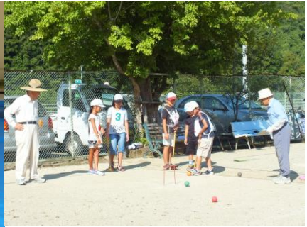
8/28 夏休み子供クローカー大会 7チーム総当たりの大会で見事全勝で優勝を飾ったのは小松Aチームでした。