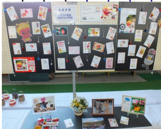
趣味の作品をはじめ、丹精込めて育てられた農産物など多数の出品物に来場者の目も釘づけ