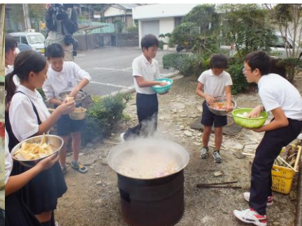
10/4 クローカー&いもたき いもたきの仕込みから仕上げまで6年生で行いました。