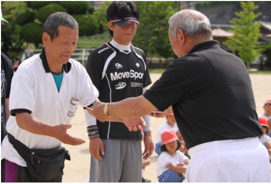
下大野部落が196点で総合優勝を飾りました。