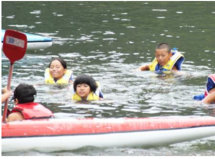
7/26~27 戸祇の子キャンプ カヌー体験より、川遊びのほうに夢中になったようでした。

戸祇の子学級の開催には、老人クラブの方々をはじめ地域の方々には大変お世話になりました。学級活動の様子をご紹介します。