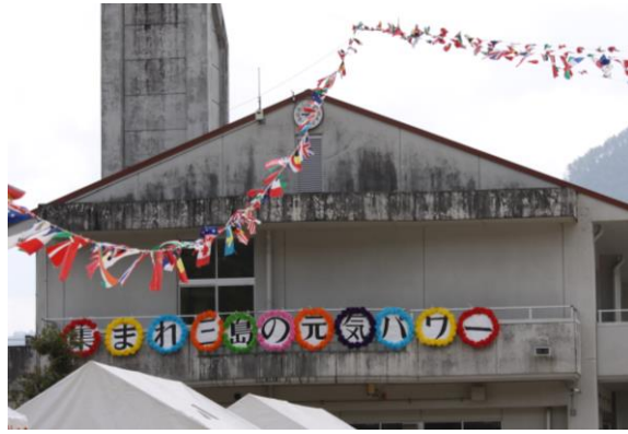
「集まれ三島の元気パワー」の大会テーマの下、天候にも恵まれいよいよ大運動会の始まりです。