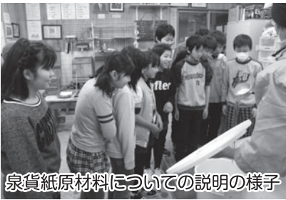
泉貨紙原材料についての説明の様子

2015年3月 近永公民館 編集：高田義勝 TEL 45-1111 内線4410 FAX 45-2810