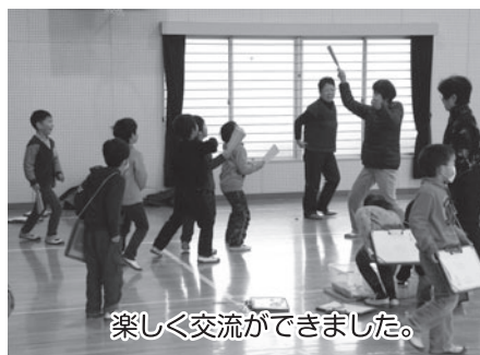
楽しく交流ができました。

2月10日、近永小学校屋内運動場で、近永小学校1年生児童を対象に「昔の遊び体験教室」が開催され、老人クラブ近永支部会員の皆さんの指導で、あやとりやメンコ、お手玉など、12種類の昔の遊びを体験しました。休憩時間になっても休むことなく、小学生とおじいちゃん、おばあちゃんとの白熱した対決が数多く行なわれていました。 児童にとつては、普段あまりすることのない遊びでしたが、終始笑い声が絶えず、子供、お年寄りともお互いに元気をもらった体験教室になったようです。