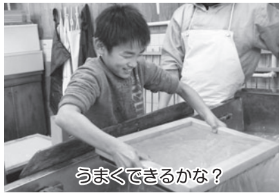
うまくできるかな？