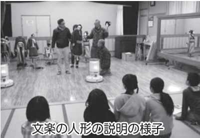
文楽の人形の説明の様子