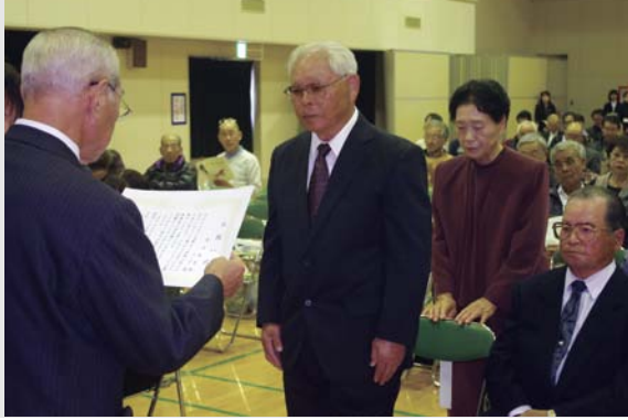
お祝い状を受け取るご夫婦

11月7日、広見中学校体育館で「平成26年度きほくふれあい音楽会」が開催され、町内の小学校が参加しました。 第1部の合唱と第2部の合奏に分かれて行われた音楽会。各学校の児童生徒らは、振り付けやソロパートなど、それぞれに趣向を凝らした演奏を披露し、会場内に伸びやかな歌声や迫力ある演奏を響き渡らせました。 懸命に練習を積み重ね、徐々にその技を洗練してきた児童生徒たち。その思いのこもった歌声や演奏が、観客らの心を惹きつけていました。