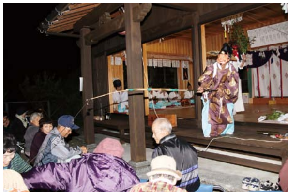
◀観客との駆け引きが魅力の「恵比寿の舞」