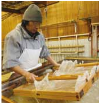
紙すき作業の様子