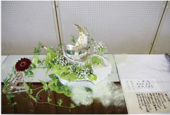
生花でシンデレラの一場面を表現