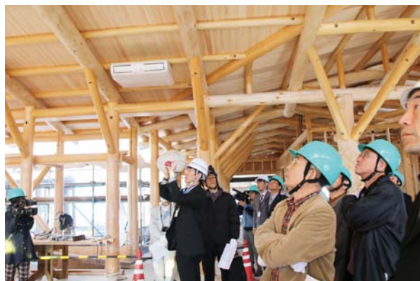
◀説明を聞きながら見て回る参加者ら

11月15日、完成を間近に控えた鬼北町役場増築棟の見学会が行われ、事前に申し込みのあった30人が参加しました。