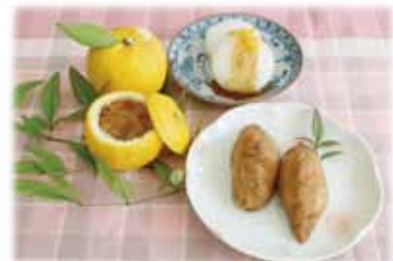
食生活改善推進協議会日吉支部