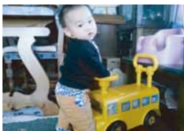
うつのみや たいが 宇都宮 帝駕くん