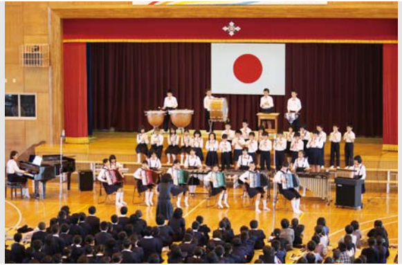
息の合った演奏を披露する児童ら

「きほく生花・お茶会展」は11月8日と9日の2日間、広見体育センターで開催されました。会場内に繰り広げられる小原流や池坊など5流派による共演、それぞれの特徴が見事に表現された生花の数々が、訪れた人達を魅了していました。また、毎年恒例となっている童話をテーマにした生花。今年は「シンデレラ」のストーリーが表現され、その巧みな技術が来場者らの関心を集めていました。 また9日には、同会場でお茶会が行われ、その所作と点てられたお茶が、訪れた人たちを和ませていました。