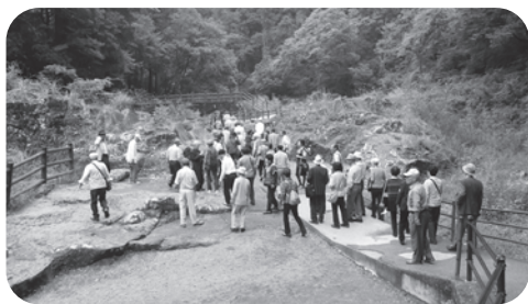
▲高千穂峡散策の様子