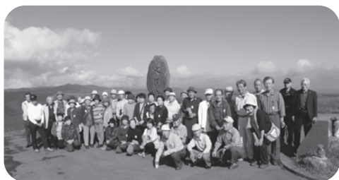
▲阿蘇・大観峰で記念撮影