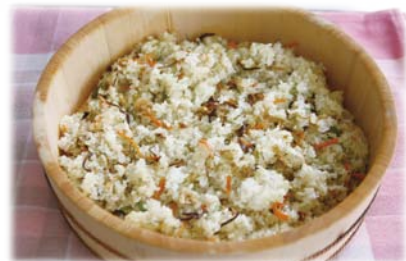
食生活改善推進協議会日吉支部