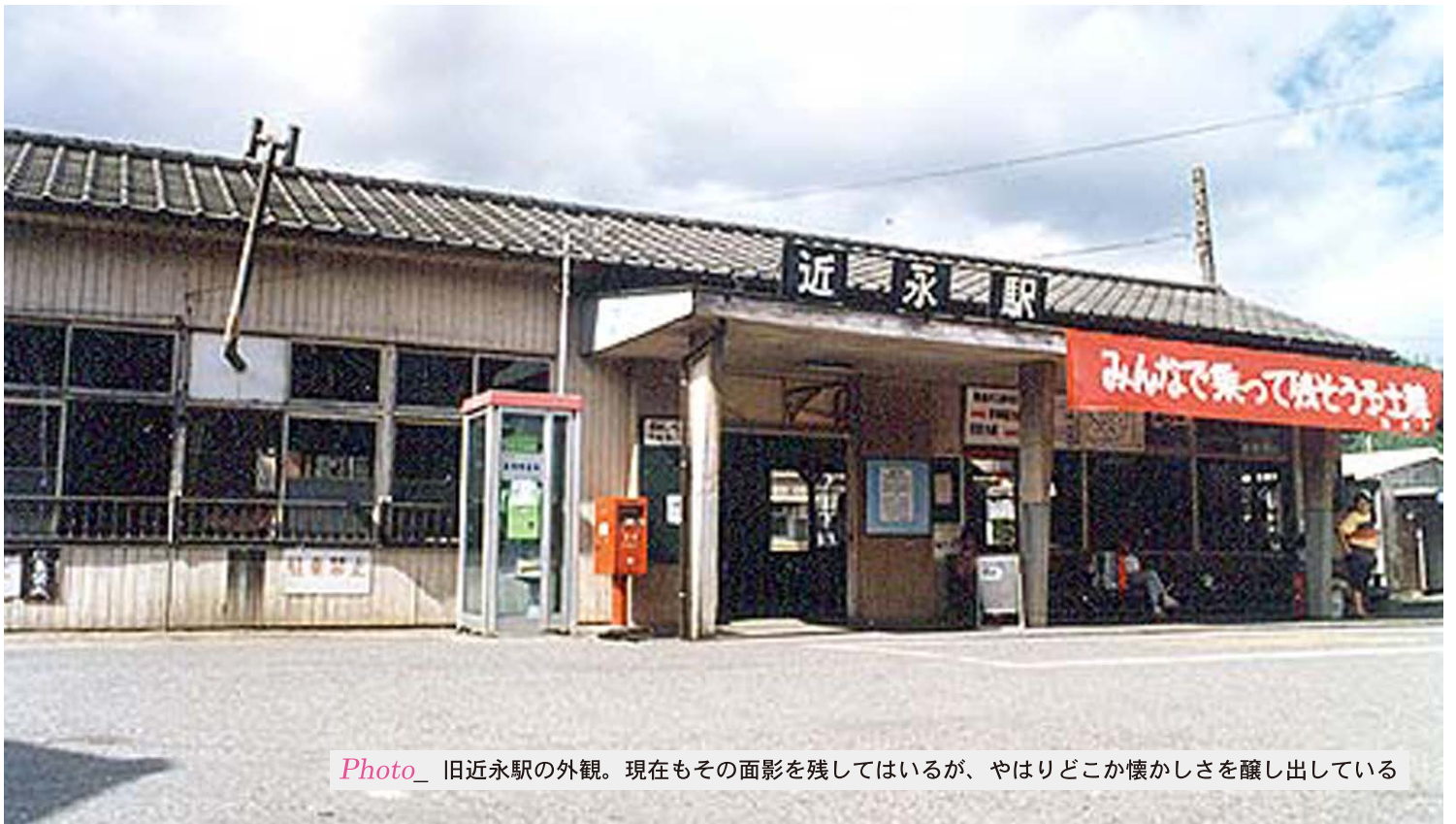
Photo_ 旧近永駅の外観。現在もその面影を残してはいるが、やはりどこか懐かしさを醸し出している