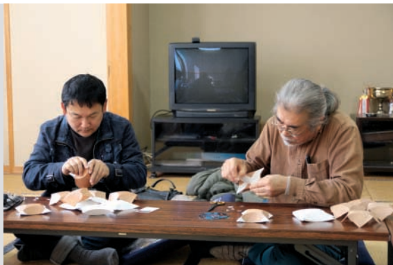
真剣な表情で作業する参加者