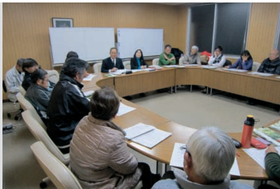
活発に意見を出し合う出席者ら

12月10日、日吉中学校体育館で「平成25年度中学生選挙啓発講座」が行われました。この講座は、選挙制度等についての周知や、政治や選挙への関心を高めることを目的に、愛媛県選挙管理委員会が実施しているもので、この日は、実際の選挙で使われる記載台や投票箱を用いて、模擬投票や模擬開票などを実施。投票管理者や投票立会人などの役割も生徒が受け持ちました。生徒たちは「選挙について詳しく知らなかったけど興味を持てた」「20歳になったら選挙に行きたい」など、この体験を通して選挙への関心と知識を深めていました。