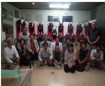
【閉講式前に】 長い間、おつかれさまでした