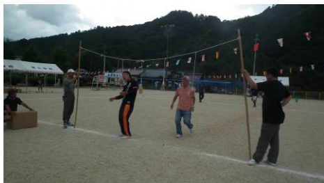
【それいけ？パンマン】