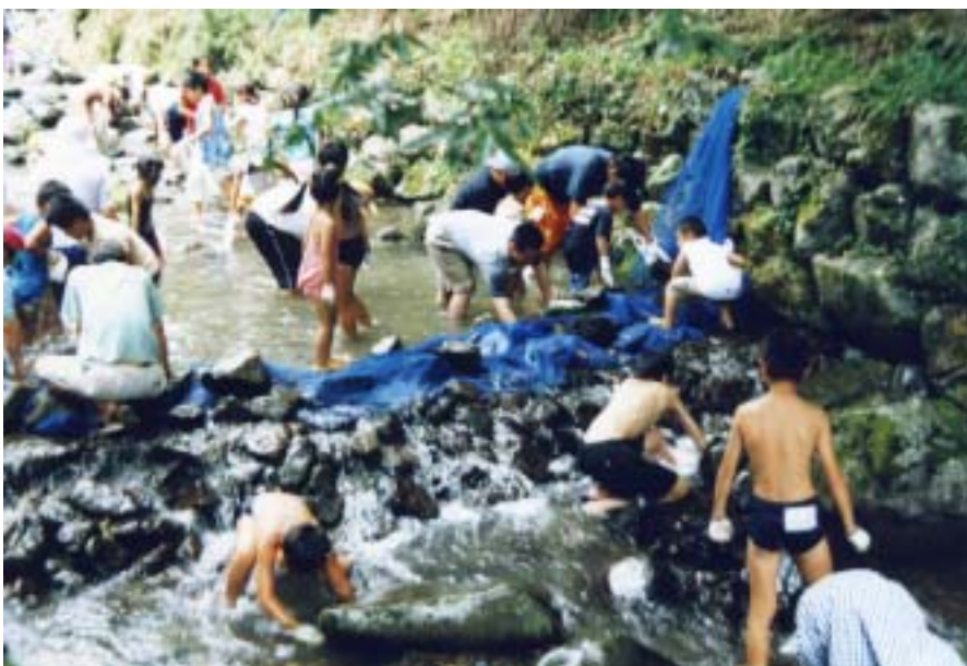
せせらぎ魚っちゃんぐ

今年度の主な活動として、春と秋の夢産地イベントでの出店、節安でアメノウオ釣りやつかみどりなどの川遊びができる「せせらぎ魚っちゃんぐ」開催(7月16日)、日吉人の心意気をPR宇和島牛鬼まつりパレード参加(7月24日)、伝統保存のために武左衛門ふる里まつり参加(8月14日)子どもの笑顔がみられる明星ヶ丘での納涼夜市開催(9月2日)、日吉の夜をちょっとだけドレスアップするイルミネーション設置、会員の慰労と見識を広めるための研修旅行、鬼北町長との懇談会、先人たちの偉業のPRなどを予定しています。