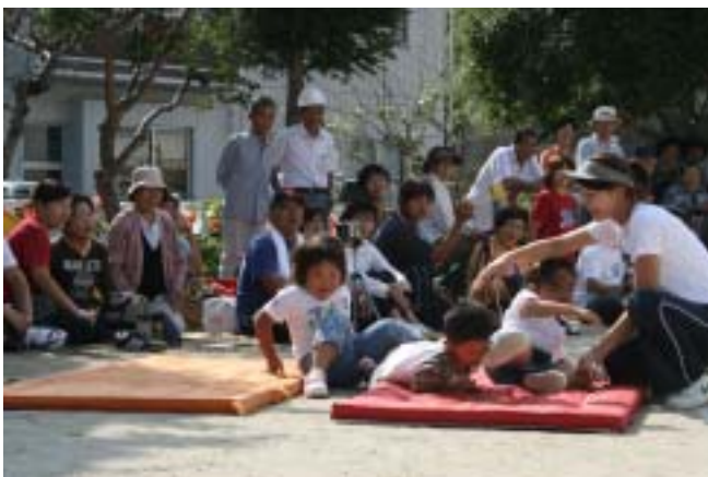
あ痛たたーっ 足はいつてるって！