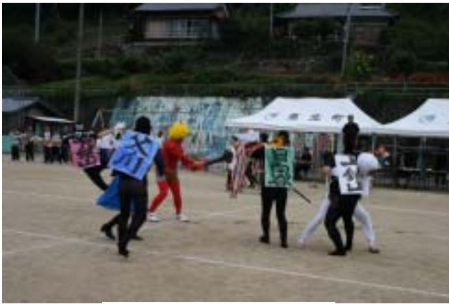
迫るー ショッカー

9月30日(日)、スポレク日吉2007が開催されました。運動会の部では1点差の激戦を制した上大野分館が、日向谷分館をおさえて見事二連覇を達成しました。