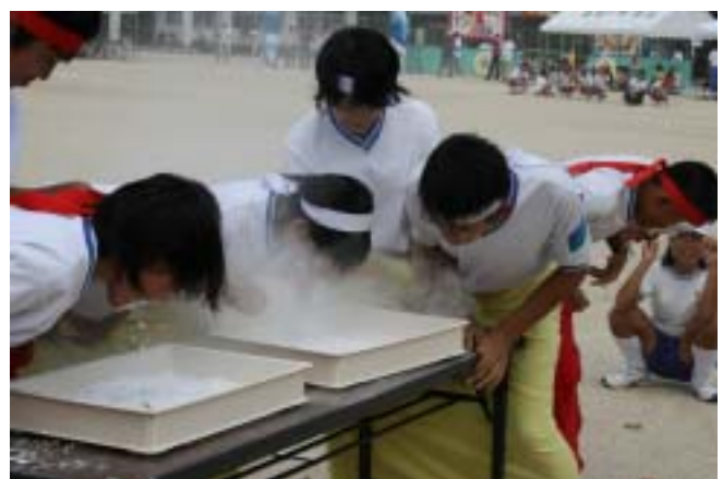
顔面 粉だらけ 飴ちゃんどこよ！