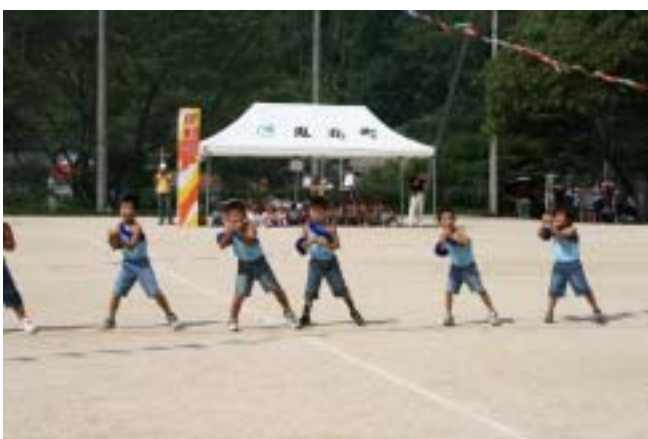
でも そんなの関係ネー！