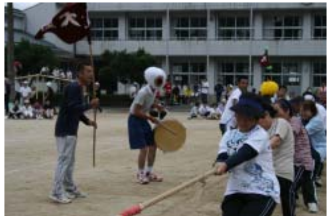
目玉おやじが 太鼓で応援！