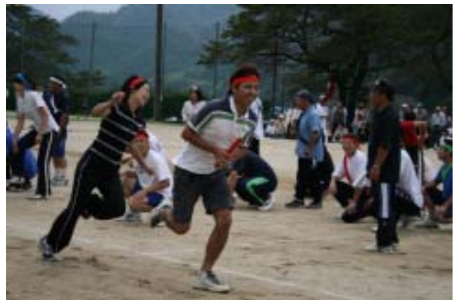
「後はお願いっ！」「よっしゃ 任せとけー！」