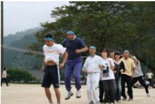
フライング？ 誰ですかー！

午後からの軽スポーツ大会では、レクバレー、ペタンク、クロッキーが行われ、選手の皆さんは日頃鍛えた技を存分に発揮されました。