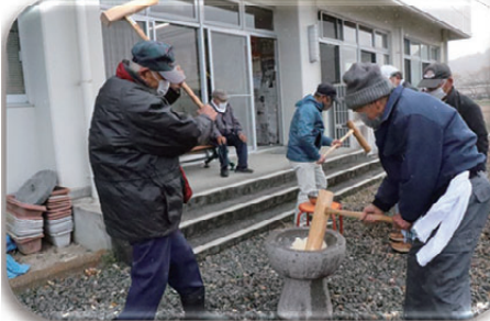
▲雪ノ寒サニモマケズ