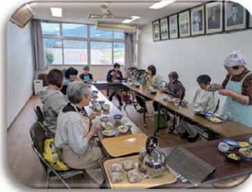
食生活改善推進委員会