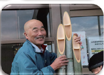
▲口を揃えて笑顔にな。