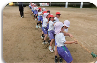
▲絶対勝つぞ！えいえい、おー！