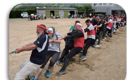
▲来年も子供らに挑もうで