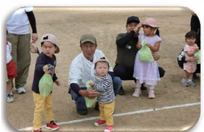
▲親も、じいちゃん、ばあちゃんも、癒しの幼児たちにメロメロです。