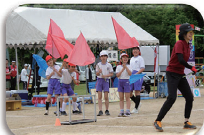
▲ドキドキ・・・運命の旗は!?