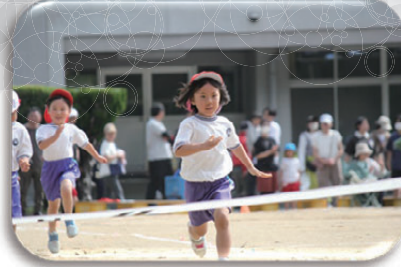
▲ダッシュ！ゴールは目前