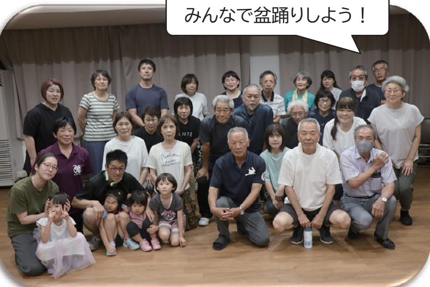
みんなで盆踊りしよう！