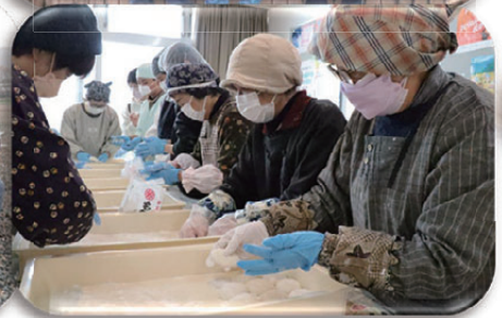
餅つき&しめ飾り作り(12/26)