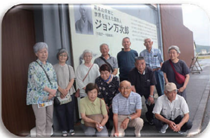
福祉ボランティア協議会研修