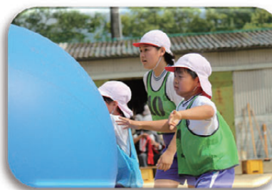
▲息を合わせて大玉転がし