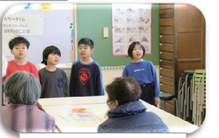
ハーモニカ演奏会