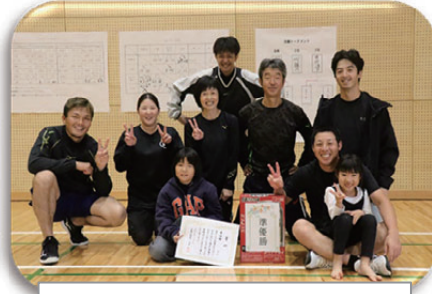
準優勝：成藤Aチーム