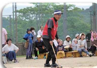
▲これが、なかなか難しいんよなあ。