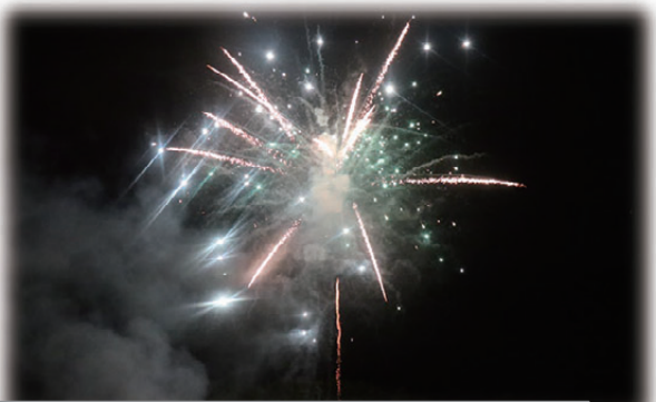
多くの方にご来場いただき、踊りや花火を楽しみました。 たくさんの方の寄付金をありがとうございました。