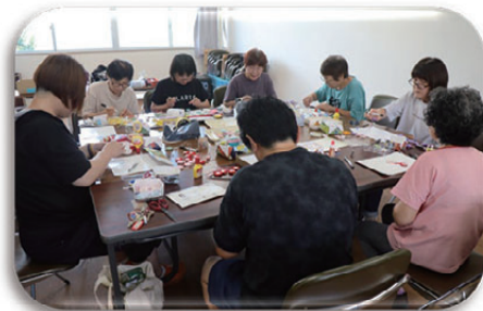
ピーチパイ(女性団体)