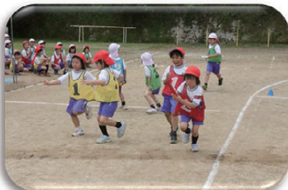
▲みんなでつなぐバトンの重みを感じながら、力いっぱい走ります。