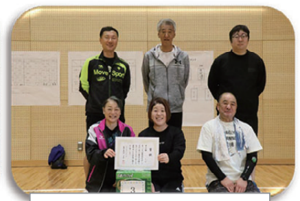
3位：東仲B連合チーム