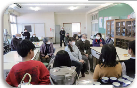
土手焼き連絡協議会