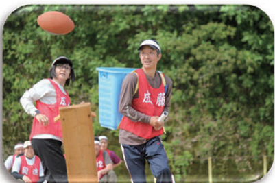
▲ナイスキャッチで今年も円満