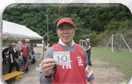
▲な-んか出るような気がしたんよ