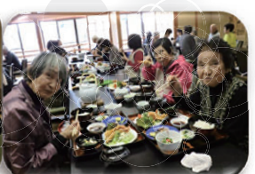
一日研修旅行(11/18)高知県佐川町