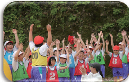
▲また来年も、満面の笑顔を見せてね