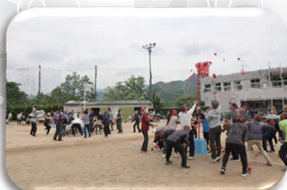
▲1個ずつ派?まとめ投げ派?