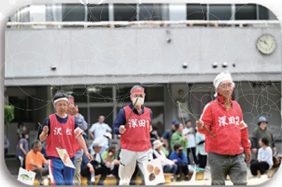
▲勝敗は区長の肩に!?