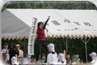
▲「がんばるぞー！」気合いが入りました