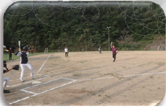
▲始球式でプレーボール