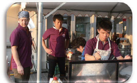
ありがとう会(好小、いきいきクラブ交流)