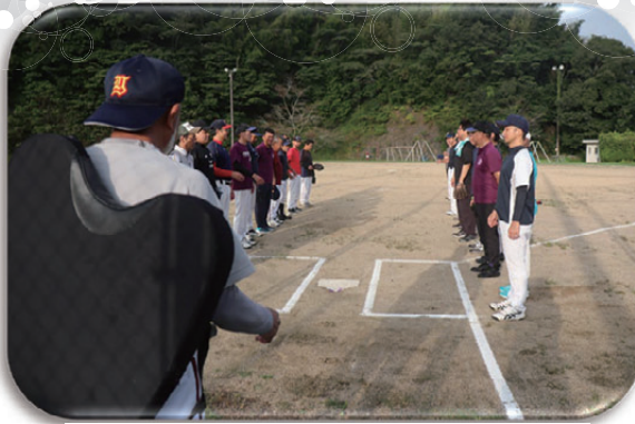
▲審判が一番体力勝負なんです。