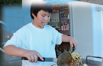
YVC体験(やきそば作りを教わったよ)