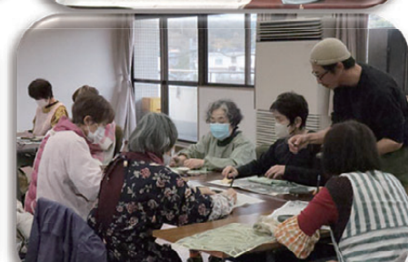
昔遊び交流会(10/27) ～好小児童と一緒に～