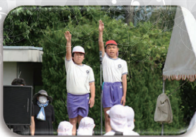
▲ピシッと最高学年の貫禄