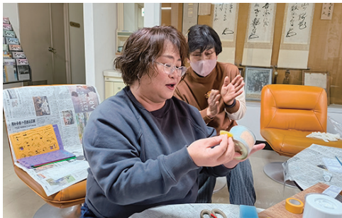
↑ サビ風加工中。リメイク缶のおしゃれ度が一気に上がりました！