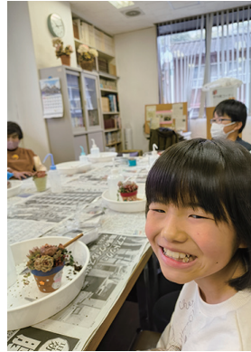
← 順調な仕上がりににっこり笑顔♡