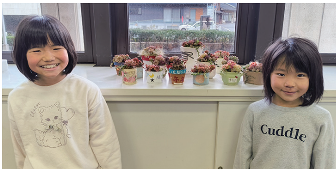
植え方によって見た目もそれぞれ違います。どれも素敵な寄せ植えが完成！