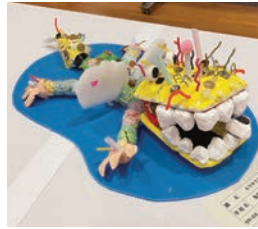
作品「キラキラワニさん」

これからも大切にしたいことは、その場に行つて『本物』に出会い、その発せられる魂の衝撃に揺さぶられることである。メディアを通して見聞きするのでは比べようもない感動がある。「皆さん、是非『本物』を見に出かけませんか」