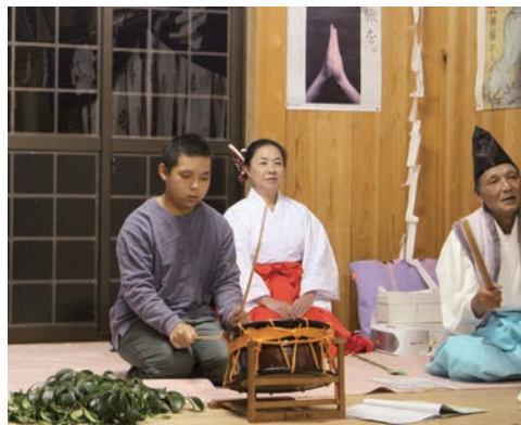
富母里神楽で太鼓をたたく中学生