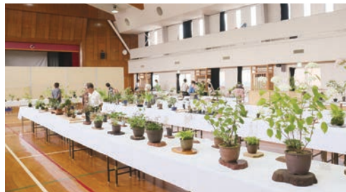
初夏の山野草展の様子