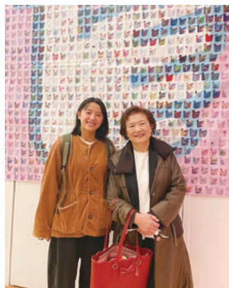
幼稚園児作成 文化祭ロゴマークのモザイクアート (ながさきピース文化祭2025ながさきピースアート展にて 事務局・会長)