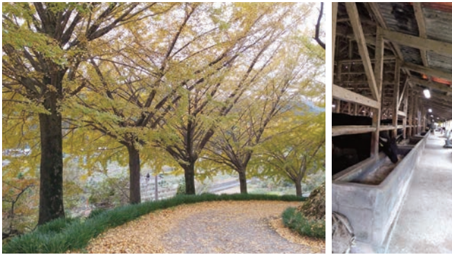
西予市の銀杏と牛舎

コロナのためまとまって行くことはなくなったが、各自が俳句の種をさがしに遠出をする。旧愛治中を移築した牛舎を西予市に訪ねた。小さな銀杏の木を植えてスタートした牛舎は、今年でしまいとなる。木は