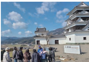
楽しいガイド付きの大洲研修