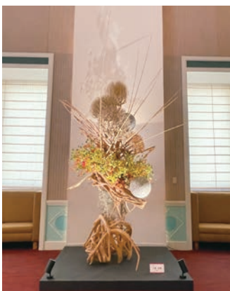
小原流お家元の大作 (ながさきピース文化祭2025 いけばなの祭典にて)

日頃より鬼北町文化協会への御支援・御協力をいただいております。鬼北町・鬼北町教育委員会・地域町民の皆様方に厚くお礼を申し上げます。今後とも、御指導・御鞭撻をいただきますようお願い申し上げます。