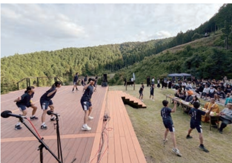
等妙寺deぞえな祭の様子