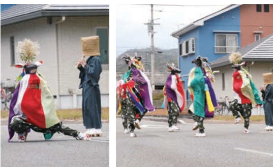
令和 6 年度開催時の様子

今後、伝統芸能の継承には課題が山積している。子供の数の減少・指導者の高齢化等々、挙げればきりが無い。厳しい状況ではあるが、先人が熱い想いを持って繋いでいただいた響を何とか次世代に繋げられるように努力していきたい。そして、近永の秋祭りに映える優雅な五つ鹿踊りの風景を、後世に繋ぎ伝えていきたい。