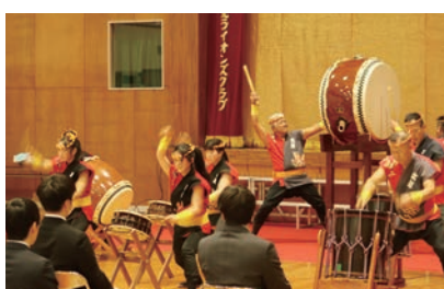
会長と会長のお孫さんが一緒にステージに立つ様子