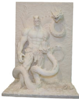
鬼北町議会 議長賞