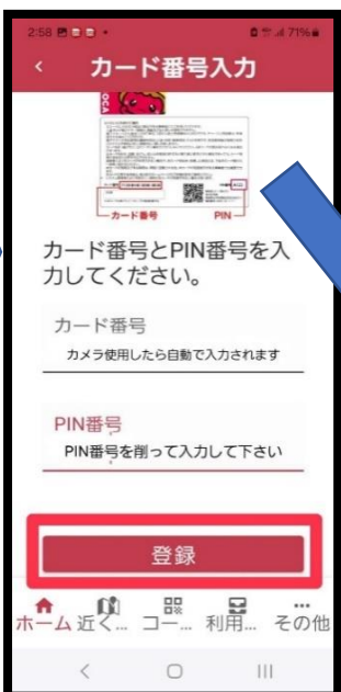
⑭ KIHOKAカード裏にある QRコードを読み取る ※自動でカード番号入力 KIHOKAカード裏にある P I N 番号の右側を削り 4桁の番号を入力し 【登録】をタップ