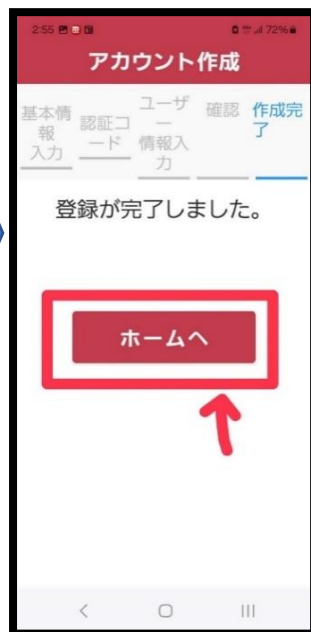
⑪ 【ホームへ】をタップ