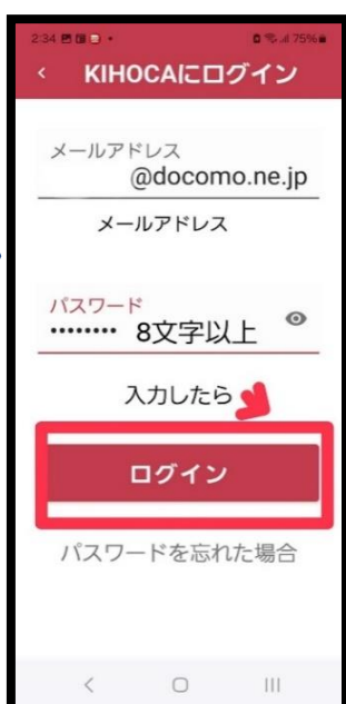
⑥ 【ログイン】をタップ