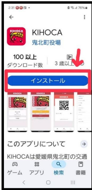
① Google PlayストアからKIHOCAを検索 【インストール】をタップ

※準備物：スマートフォン・KIHOCAカード・KIHOCA用のパスワード(8文字以上)