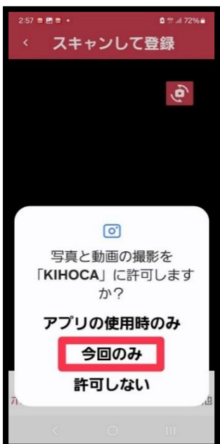
⑬ 【今回のみ】をタップ しカメラを起動