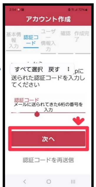
⑧ メールで送られてきた6 桁の承認コード番号を入力 し【次へ】をタップ