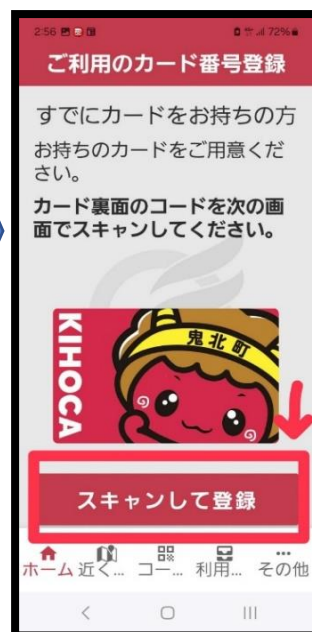
⑫ 【スキャンして登録】を タップ