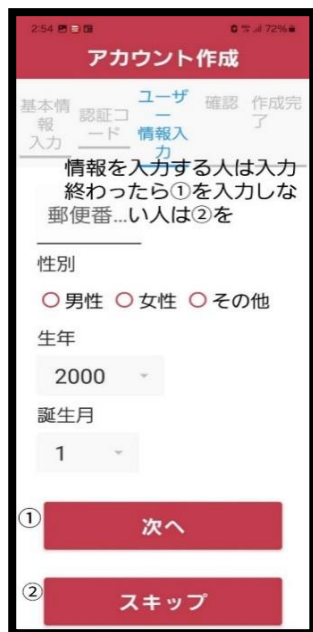
⑨ 情報入力 ※任意 入力後【次へ】をタップ 又は入力せず【スキップ】 をタップ