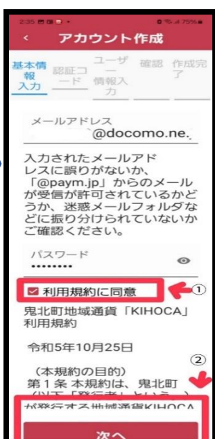
⑦ 【利用規約に同意】を タップ ※☑が付く 【次へ】をタップ