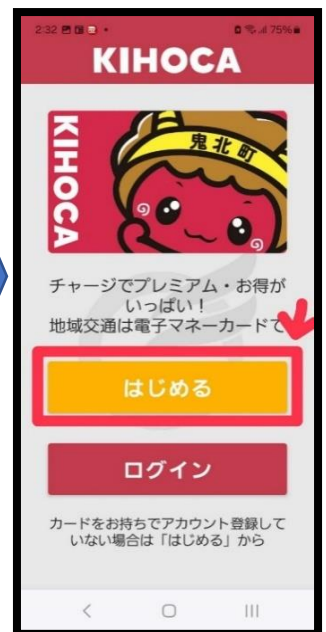
④ 【はじめる】をタップ