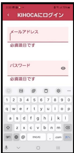
⑤ メールアドレスと KIHOCA用のパスワード(8 文字以上)を入力