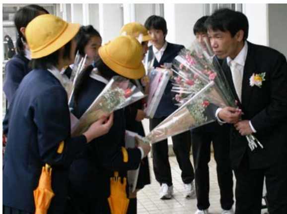
⑥先生にお別れする卒業生

3月17日(水)日吉中学校、3月24日(水)日吉小学校で卒業式が行われました。中学生18人、小学生10人が緊張と入学した頃の写真や在校生から卒業生への言葉もあり感動の中、学びし校舎をあとにしました。