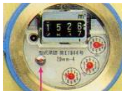
パイロットマーク