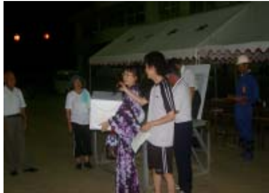
おめでとうございます