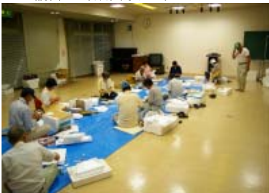
教室での製作風景