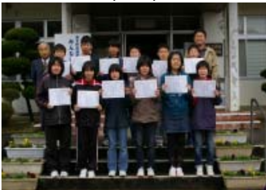
みんな揃って記念撮影