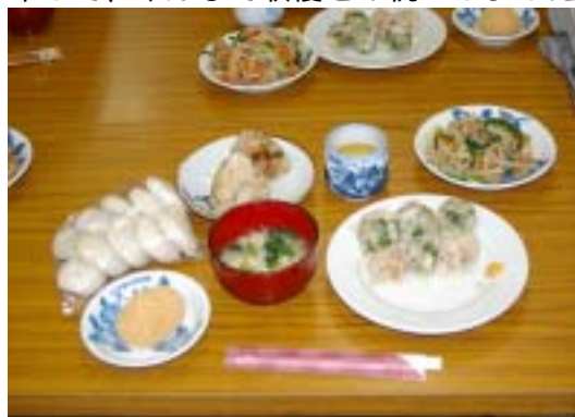
会食に用意された料理 (とてもおいしかったです)

この他にもおはぎを作り、この分は泉小学校全校児童や小倉保育所園児にも配布して、みんなで収穫をお祝いしました。