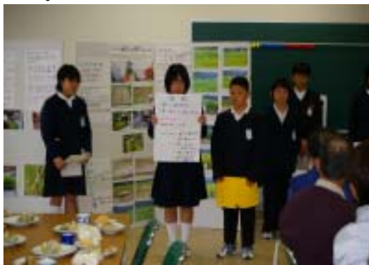
活動の調査内容を発表する児童

手づくりの掲示板を立て掛け、児童達がこれまでの活動の感想や苦労した話、苗の生育状態の調査内容を発表し、招待者らは熱心に耳を傾けて聞き入っていました。