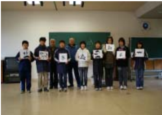
作品と一緒に記念撮影

この日の学級生は8名の出席に留まっていたしましたが、参加者は講師の指導のもとアートナイフを巧みに操りながら自分の作品を慎重に作り上げました。