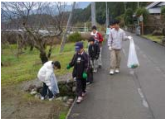
ゴミのポイ捨てはやめようね

2班に分かれて国道や県道沿いのゴミ拾いを中心に清掃活動をした結果、空き缶やたばこの吸い殻等を数多く収集することが出来ました。このことにより地域の環境美化の大切さを学んだ半面、自分勝手に不要物を廃棄するマナーの悪さも感じた1日となりました。ちなみにこの日1時間で収集したゴミは町ゴミ袋(小)にして3つ分でした。