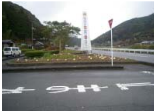
- 小倉 -