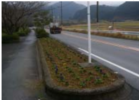
- 出目2区 -

今回花苗の植栽には、町から配布のあった「パンジー」が使用されました。まだ開花前のため現時点では華やかさはありませんでしたが、次第に道沿いで色とりどりの花が咲き誇るものと思われます。