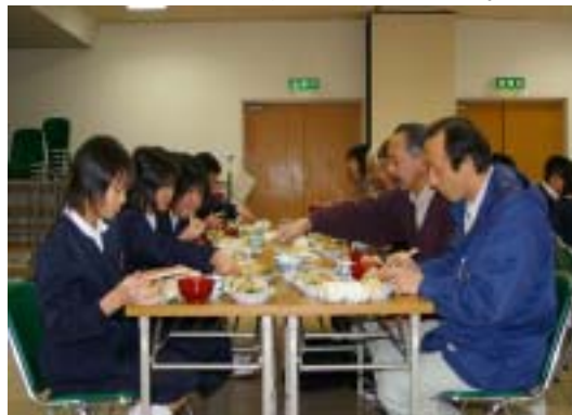
会食を共にする児童と招待者

6年生は今後の色々な活動にこの体験をいかして頑張ってもらいたいと思います。また、米づくりにご協力いただいた皆さん本当にありがとうございました。