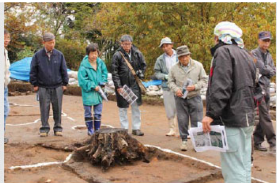
職員の説明に熱心に聞き入る参加者

「遺跡まつり」は11月25日、泉小学校、泉公民館、岩谷遺跡公園を会場に行われました。 泉小学校体育館では、牛鬼面や川柳などの作品の展示が行われ、校舎内の1階玄関ロビーでは、地域の人たちによるゆずや衣料品などのバザーも実施されました。 また、泉小学校1階和室では、先生の指導を受けながら、児童たちがお茶のお点前を披露。真剣な表情でお茶を点てる児童たちの傍らで、お客さんとして参加した児童たちも、慣れない作法に緊張の面持ちを浮かべていました。