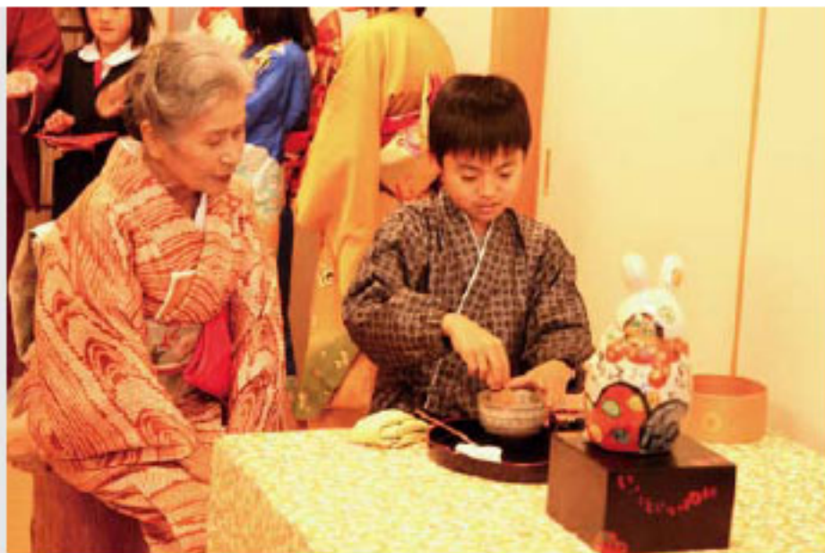
お点前を披露する児童