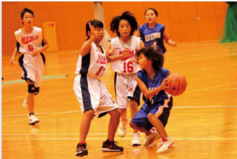
熱戦を繰り広げる選手たち

11月7日、広見中学校体育館において「きほくふれあい音楽祭」が開催され、町内の小中学校の児童生徒たちが参加しました。 斉唱と合唱が行われる第1部と、器楽演奏が行われる第2部に分けて開催されたこの音楽会。参加した小中学校の児童生徒たちは、合唱に振り付けを合わせてみたり、曲をアレンジしてみたりと、それぞれに工夫を凝らした歌声や演奏を披露。 どの学校もそれぞれの特性を生かした発表に、会場の保護者たちからは一つの発表が終わることに盛大な拍手が送られました。