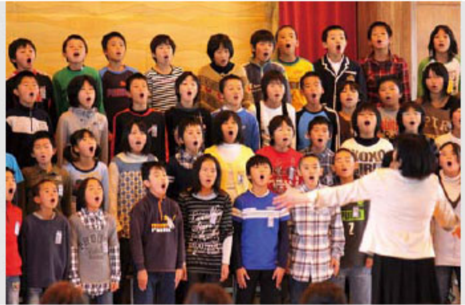
元気よく伸びやかな歌声を披露

近永公民館で合宿して学校に通学する「ワクワクドキドキチャレンジ合宿」は11月13日から17日までの5日間、近永小学校4、5、6年生を対象に行われました。今年、25人の児童がこの合宿に参加し、坐禅、ドラム缶風呂への入浴や自炊などを体験。坐禅体験では、姿勢が崩れた者が警策と呼ばれるもので打たれる行為を全員が順番に経験するなど、しんと静まりかえった部屋の中、精神の統一に挑戦しました。 合宿中さまざまな体験をした児童たち。合宿を終えたその表情には、やり遂げた自信が溢れています。