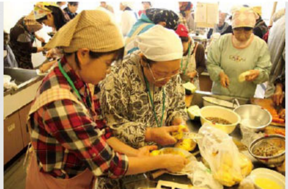
特産のゆずを調理する参加者

11月17日、鬼北総合公園体育館において「鬼北町球技スポーツ少年秋季大会」が開催されました。9月30日に開催される予定だった本大会。台風による延期のため、今年度はミニ・バスケットボールのみでの開催となりました。 この日は町内外から4チームが参加し、選手たちは日頃の練習の成果を発揮するため、懸命にボールを追いかけ、声を掛け合いながら熱戦を展開しました。 主な結果は次のとおりです。 ①広見ミニバスクラブ ②好藤スポーツ少年団 ③三間スポーツ少年団