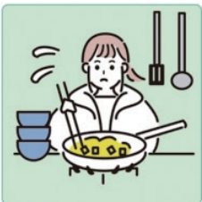
障害や病気のある家族に代わり、買い物・料理・掃除・洗濯などの家事をしている。

※子ども家庭庁 ( https://www.cfa.go.jp/aaa/ ) (参照2023.4.15)