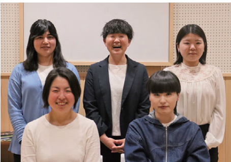
地域おこし協力隊