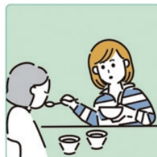
障害や病気のある家族の身の回りの世話をしている。