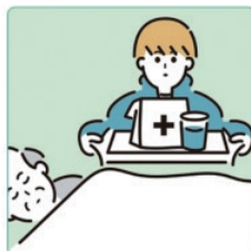
がん・難病・精神疾患など慢性的な病気の家族の看病をしている。