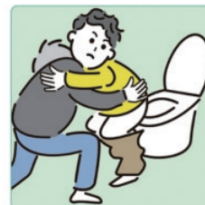
障害や病気のある家族の入浴やトイレの介助をしている。