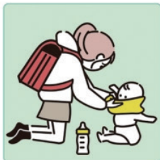
家族に代わり、幼いきょうだいの世話をしている。