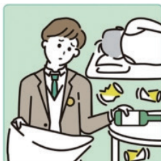
アルコール・薬物・ギャンブル問題を抱える家族に対応している。