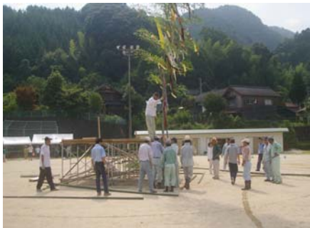
早朝から沢山の方々に出席していただき、夜の準備をしました。

役員の方々の手によって、早朝8時30分から準備をして頂きました。各部落担当となっている作業を、約2時間程行い、夜の本番を迎えました。