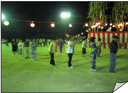
最後は全員による広見音頭で踊りの部を終了しました。