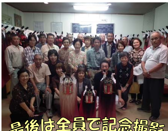
最後は全員で記念撮影

完成した作品は、でちこんかや岩谷遺跡まつりに出展する予定です。力作揃いの作品を是非、ご鑑賞して下さい。