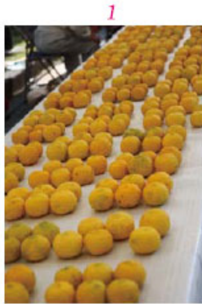
1_品評会に出されたゆず 2_箸を使って栗拾いに挑戦。何個拾えるかな 3_日吉・コールナチュレによる合唱

他にも、特設ステージ上での武左衛門太鼓、ダンスや歌などの発表やさまざまな団体の出店なども軒を連ね、訪れた人たちとともに収穫の喜びを味わっていました。