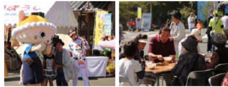
1_「にゃんよ」と「ますくまん」と記念撮影 2_秋の味覚「鬼のいもたき」に舌鼓

10月13日、道の駅・森の三角ぼうしにおいて、「いやし彩り祭り」が開催されました。