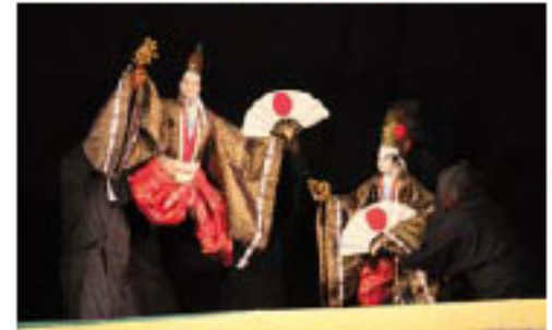
1_家串祭り保存会の「荒獅子」の舞 2_鬼北文楽の一場面