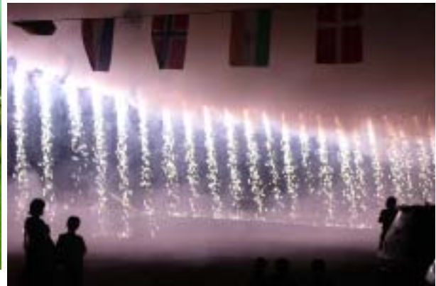
他地区からも多くの見物客がやってくる三島の花