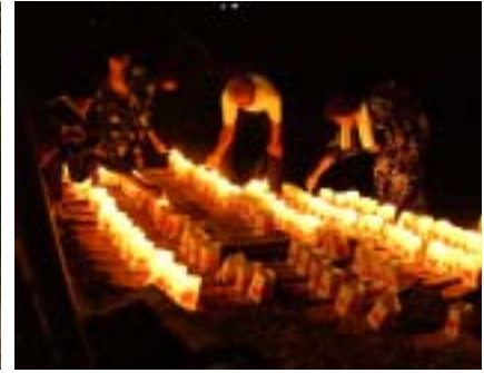
8/30 灯ろう流し 灯ろう流し保存会の皆さんが実施