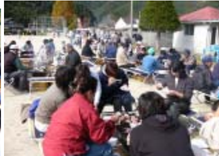
3年目となったバーベキューも大盛