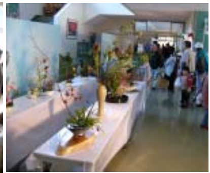
小学生の生花もかわいらしく展示