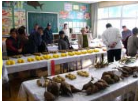
各部落から集まった野菜を品評

繰越金 10,558円 自治会 19,813円 JA三島 100,000円 森林組合 15,000円 農振協 80,000円 野菜売上等 32,480円 町報償費等 18,745円 合計 276,596円 で運営されました