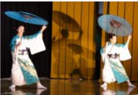
もはや貫禄の域「ゆりの会」の踊り