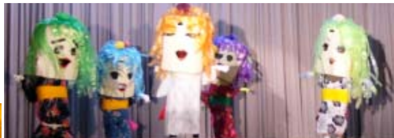
一風変わった芸を披露「青空娘隊」