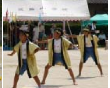
4.5.6年生が元気一杯のダンス