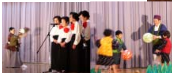
清吟堂は、合吟「手まり」と剣舞で出演