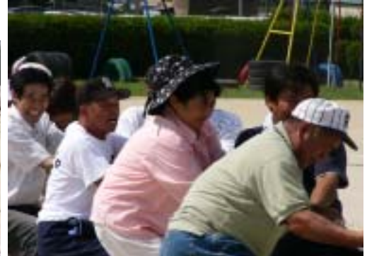
一般の部は、昨年に続き大野部落が優勝 綱引き(一般)