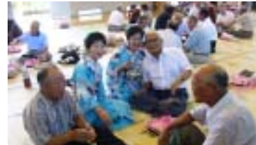
「ゆりの会」の皆さんは、舞台でも祝宴でも大活躍