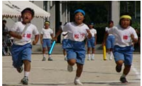
観客席から大声援が上がった 地区対抗リレー