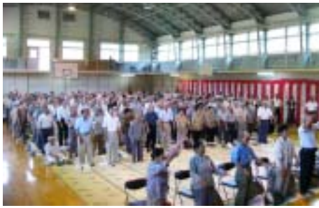
長寿を祈って万歳三唱