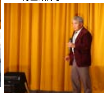
有志でカラオケを熱唱