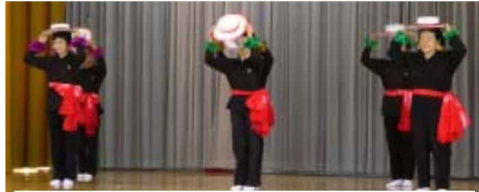
敬老会「演芸の部」2度目の出演となった「婦人会」 踊るは、「銀座カンカン娘」