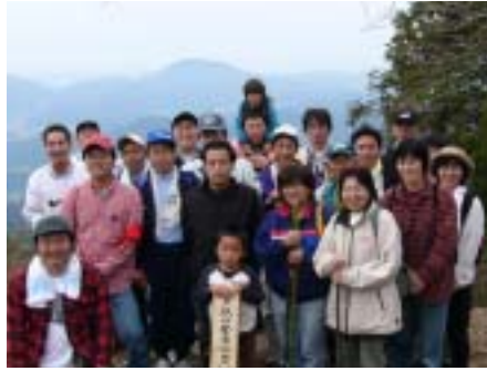
11/13 戸祇山登山 「登ろう会」のスタッフにより開催