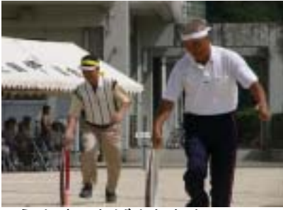
うまくつなげましたか？ 皆でつなげよう三島の輪