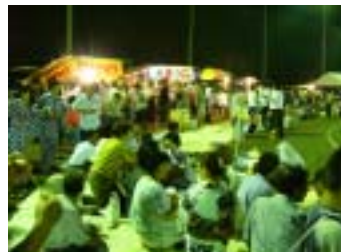
各部落の席も、本当に にぎやかです。