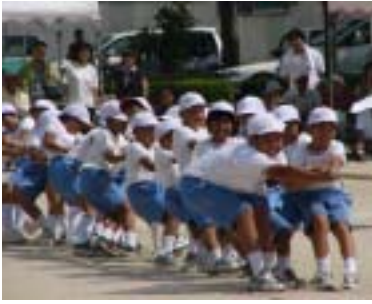
全児童が紅白に分かれ、力の大勝負

町補助金 141,000円 自治会 80,187円 合計 221,187円 で運営されました。