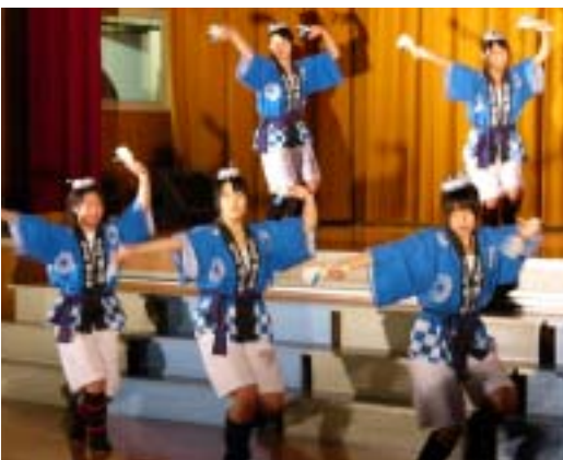
今年も広中ダンスチーム「広蓮」が登場。会場からアンコールが沸き起こった