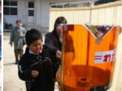
50円の綿菓子コーナーも設置