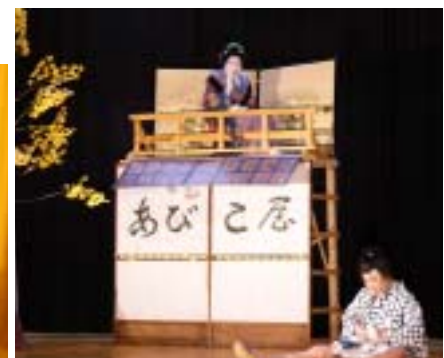
はげます会の「一本土俵入り」