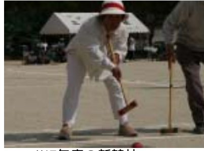
H17年度の新競技 第1フープ通過！