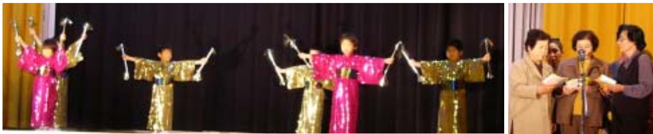
トップバッターは青組さんの「マツケンサンバ」