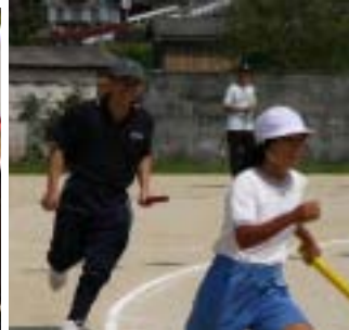
お父さんは余裕の表情か？