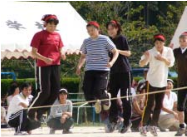
昨年から始まった女子150歳の種目 部落総当たりで行なわれた 縄跳び