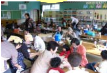
婦人会のバザーも毎年人気です