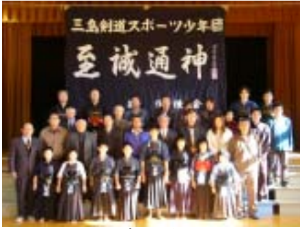
1/3 剣道スポ少 稽古初め 後援会の皆さんで行なう伝統行事