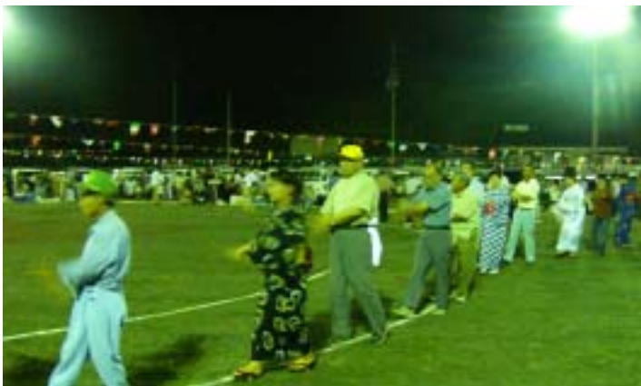
部落単位で一つの輪ができる盆踊りは、近隣町村では少なくなりました。