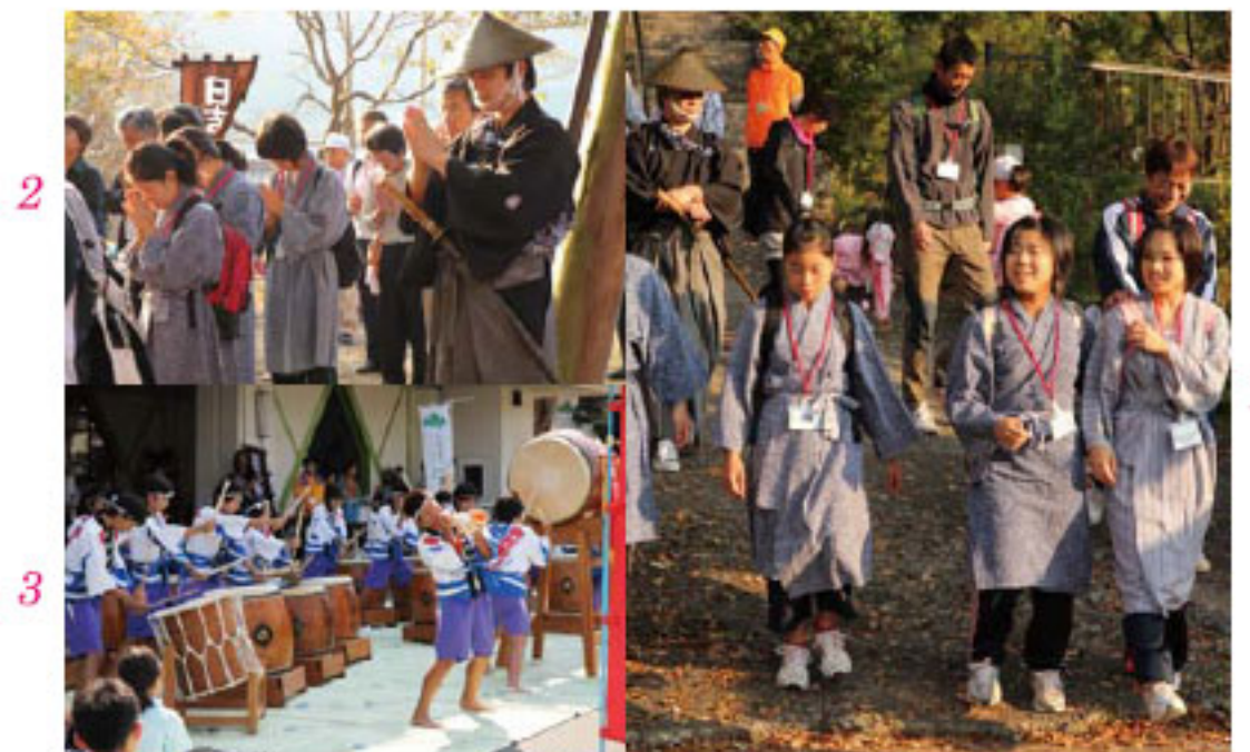
1_出発直後はまだ余裕の笑顔 2_全員で安全を祈願 3_武左衛門太鼓で激励 4_全員で記念撮影

最終的には、役場から合流した参加者も含めて75人が、宇和島市の八幡河原に到着。約9時間30分かけて40*にもおよぶ「一揆の道」を踏破しました。