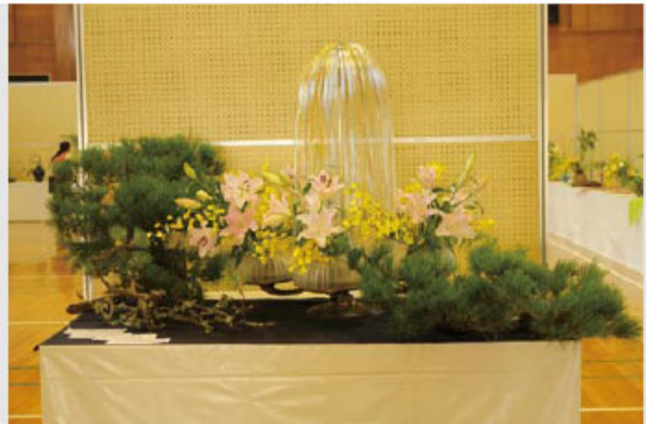
メインに飾られた合作作品

10月7日、鬼北総合公園体育館やグラウンドなどを会場に、鬼北スポレク祭2012が開催されました。 この日は、ソフトテニス、クロッケーやペタンクなど全9種目の試合が行われ、各種目に出場した選手たちは日頃の練習の成果を発揮しようと、試合に臨む表情は真剣そのもの。 しかし、真剣勝負の中にも時折笑顔がこぼれる場面も見られ、スポーツを楽しむ者同士、一つひとつのプレーを通じて交流を深めていました。