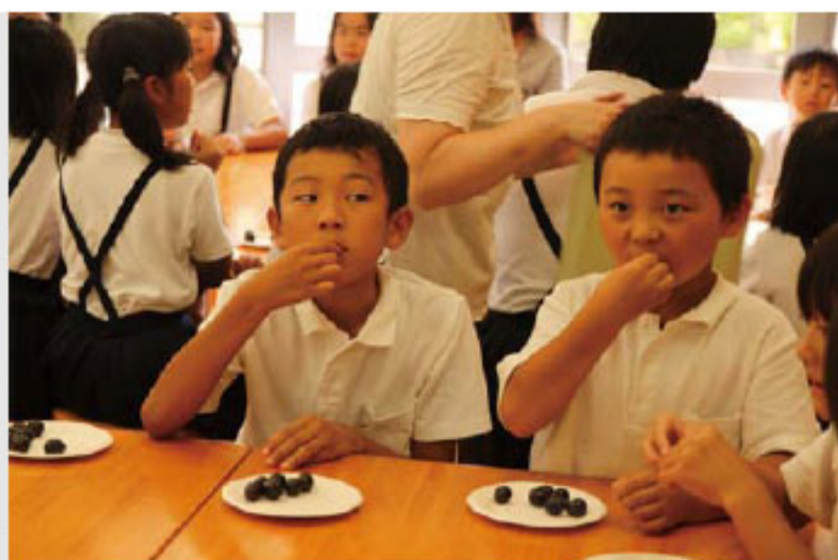
おいしそうにぶどうを口にする児童