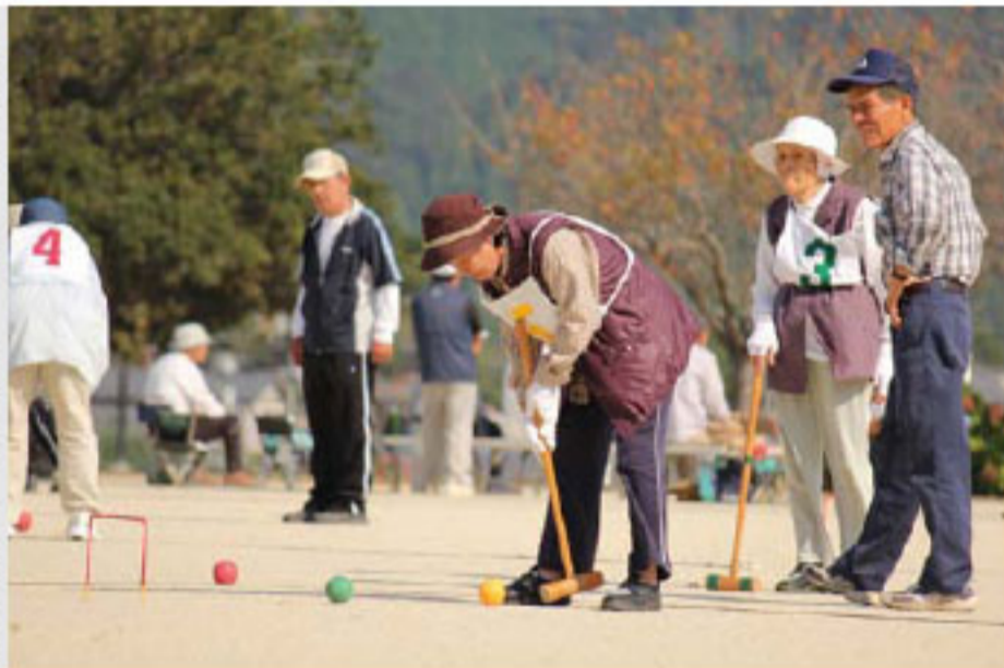
慎重にクロッケーの玉を打つ出場者

10月3日、鬼北総合公園グラウンドにおいて、実年ソフトボール大会の開会式が行われました。 実年ソフトボール大会とは、50歳以上の方を対象としたソフトボール大会で、60歳を境にホームランの境界線を変更するなど、一般のソフトボールに独特のルールを加えて行われます。 この日は甲岡町長の始球式の後、開幕試合となる近永A対泉・三島の試合が行われ、この大会では、選手は全員参加ということもあり、真剣勝負の中にも笑いが出られる試合となりました。