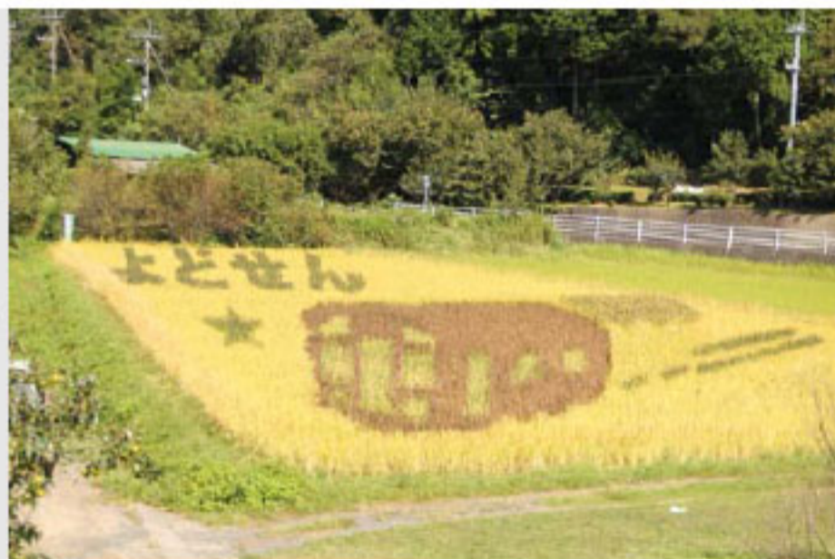
車窓から見た田んぼアート

鬼北町敬老行事は、9月6日から14日までの間、町内各地区で開催されました。 式典では、百寿や米寿の方々への表彰や記念品の贈呈が行われ、表彰者の方々は嬉しそうな笑顔を浮かべ、それらを受け取っていました。 その後、各地区の小学校児童たちがおじいちゃん・おばあちゃんとの思い出などを発表し、一生懸命発表するその姿を、出席者たちは微笑ましく見守っていました。 また、踊りや歌などといった演芸も催され、どの会場にもお年寄りたちの楽しそうな笑い声が響いていました。