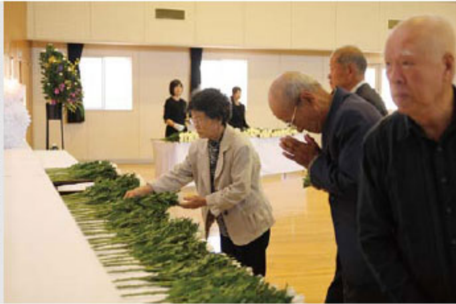
祭壇に献花を行う参列者たち