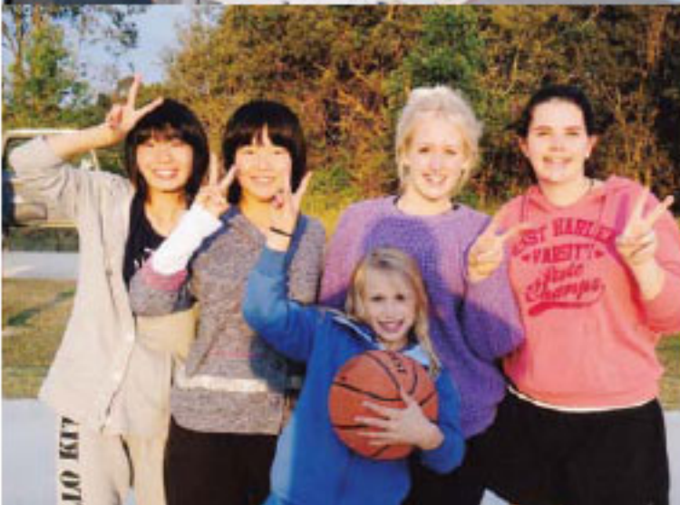
5_ さよならパーティでの一場面。それぞれのホストファミリーも参加し、別れを惜しんだ 6_ お世話になったホストファミリーの子どもたちと 7_ LONEPINE コアラ保護区でカンガルーやコアラとの触れ合いを楽しんだ 8_ 共に学校生活を過ごしたクラスメイトと一緒に記念撮影 9_ ホームステイ先ではさまざまな年代の人たちと交流を深めた